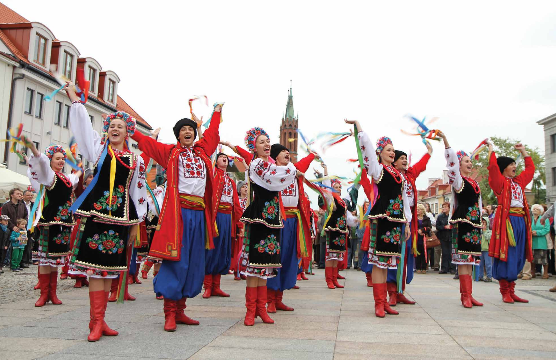
Podlaska Oktawa Kultur, Wojewódzki Ośrodek Animacji Kultury, Białystok 2015