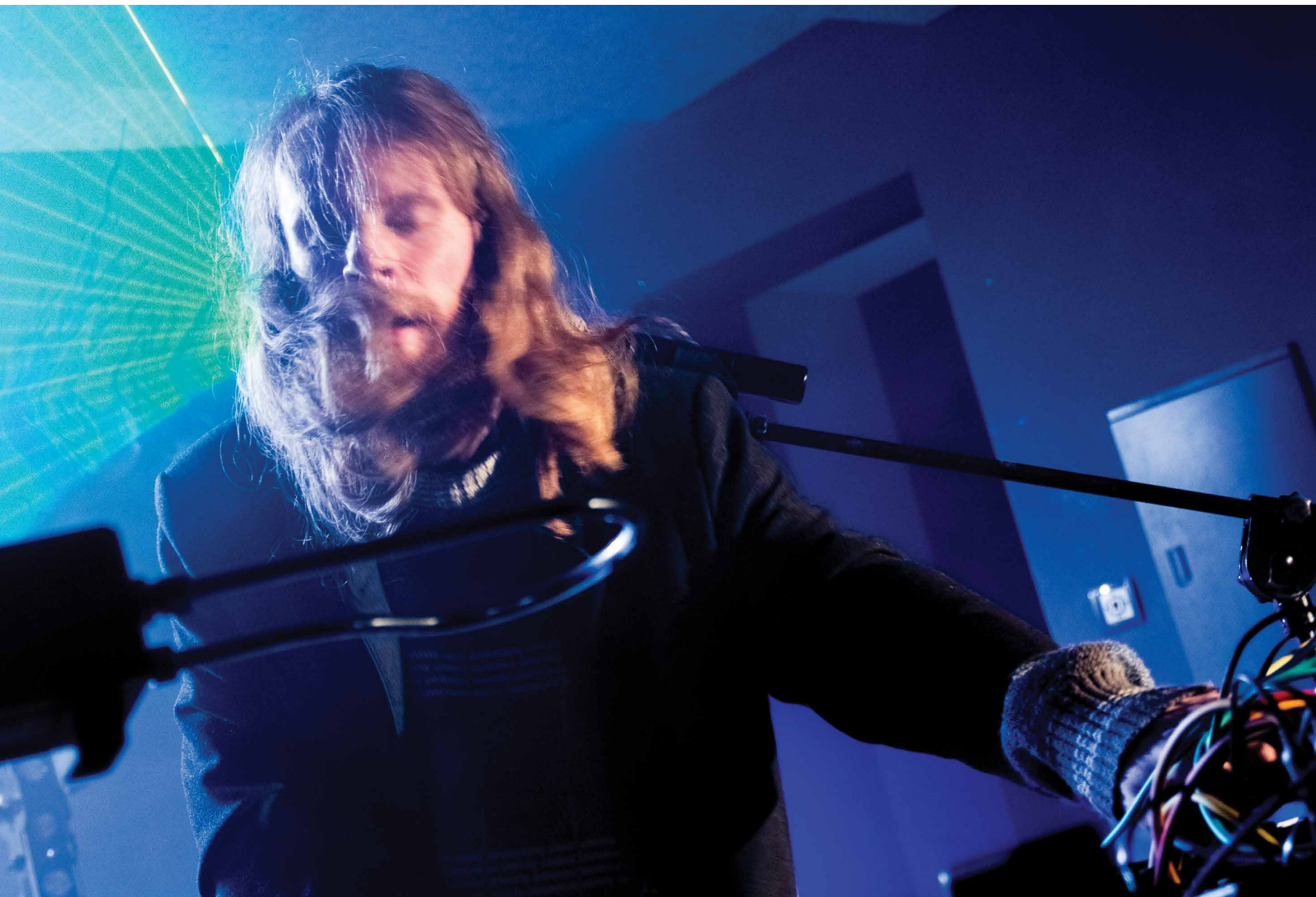
Festiwal Kultury Niezależnej „Underground/Independent?”, Białostocki Ośrodek Kultury, 2015