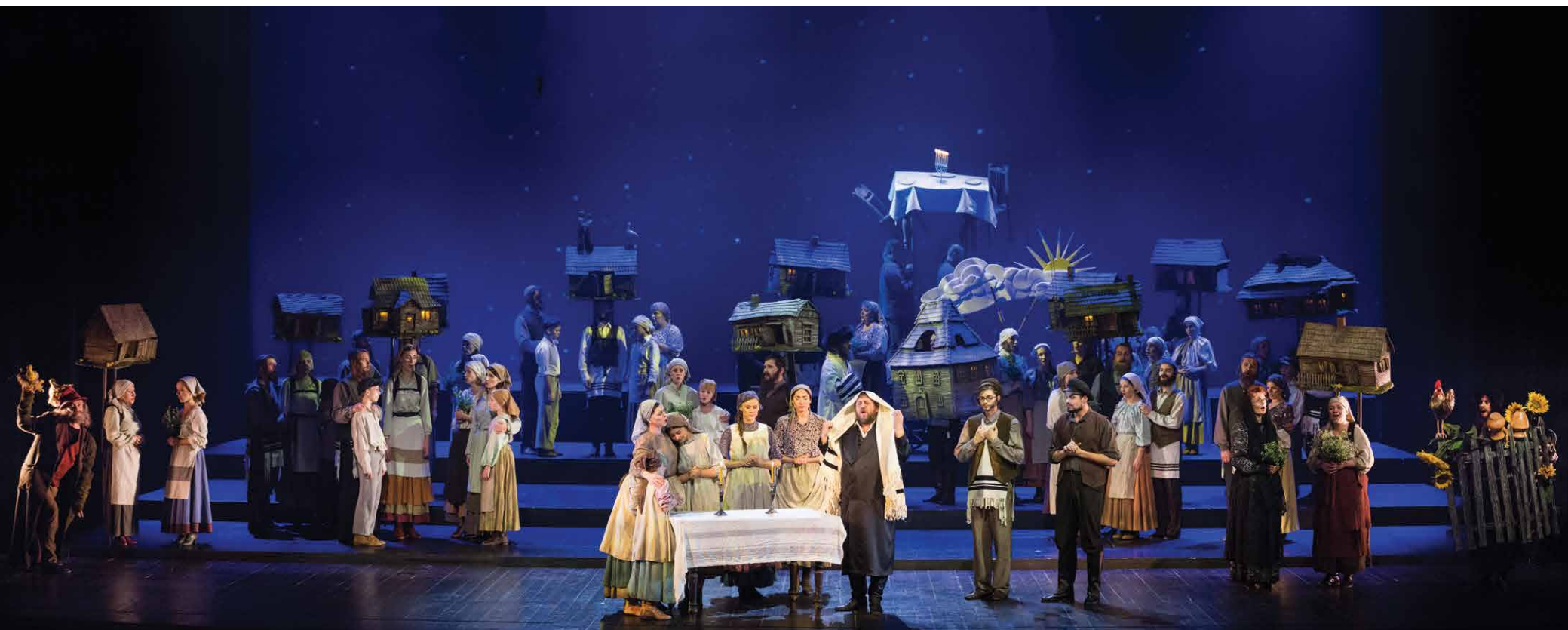
Musical „Skrzypek na dachu”, Opera i Filharmonia Podlaska