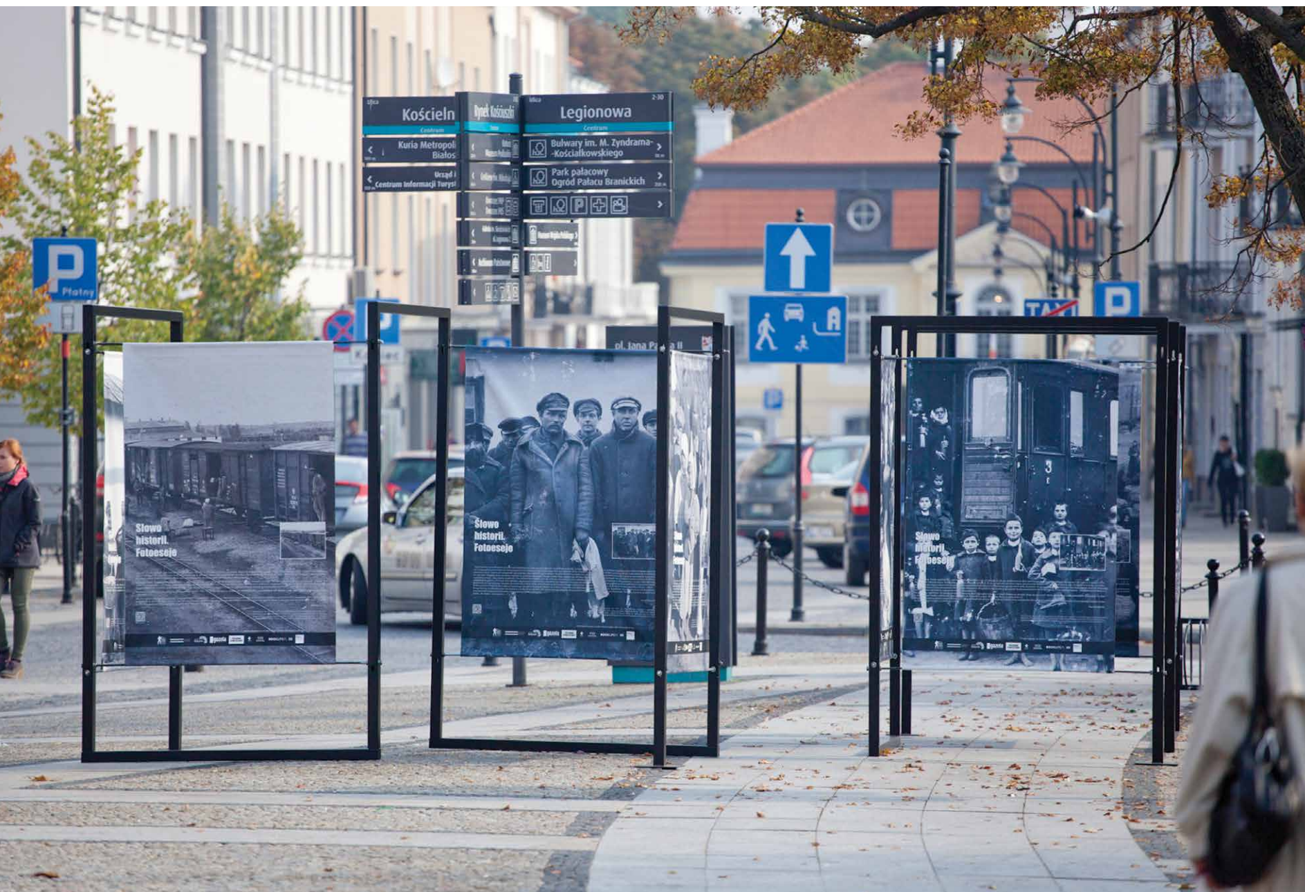
Wystawa „Słowo historii. Fotoeseje”, Muzeum Wojska, Białystok 2015