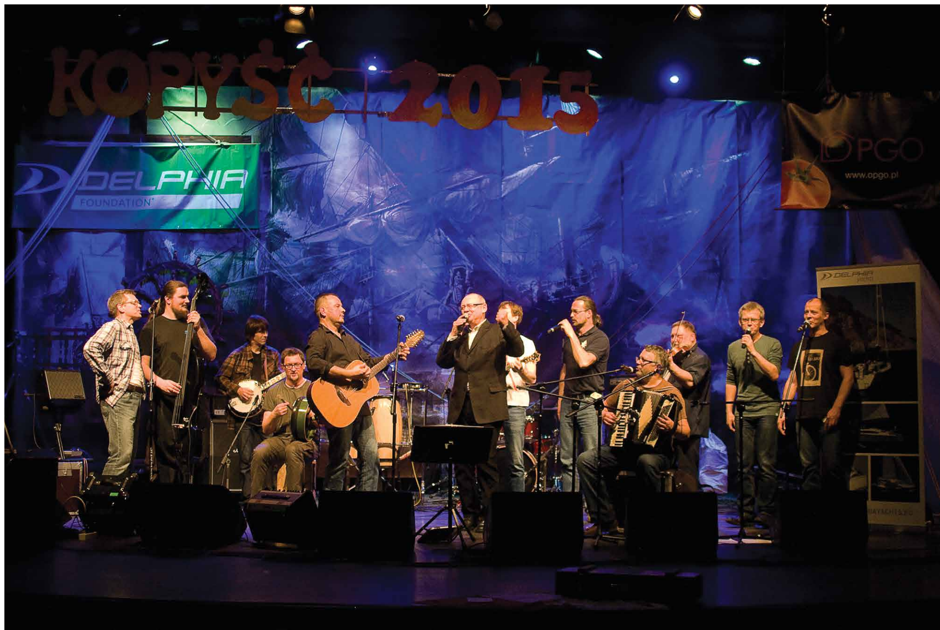
Formacja Mechanicy Shanty na XXXI Festiwalu Piosenki Żeglarskiej Kopyść 2015, Forum