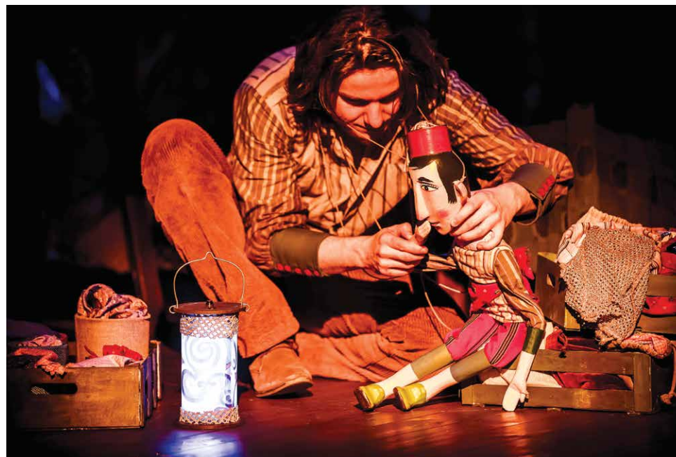
Spektakl „Cudowna lampa Aladyna” w Białostockim Teatrze Lalek