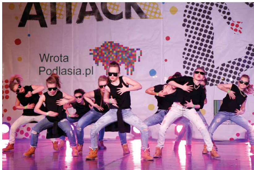
Carnival Dance Attack w Wojewódzkim Ośrodku Animacji Kultury