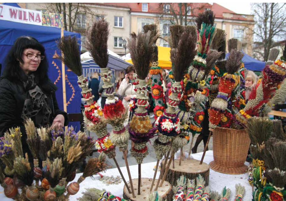
Jarmark Wielkanocny, Muzeum Podlaskie w Białymstoku