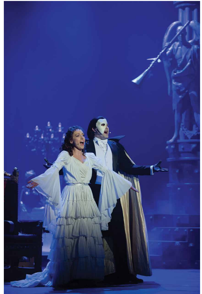
Musical „Upiór w Operze”, Opera i Filharmonia Podlaska

Organizator: Muzeum Podlaskie w Białymstoku www.muzeum.bialystok.pl