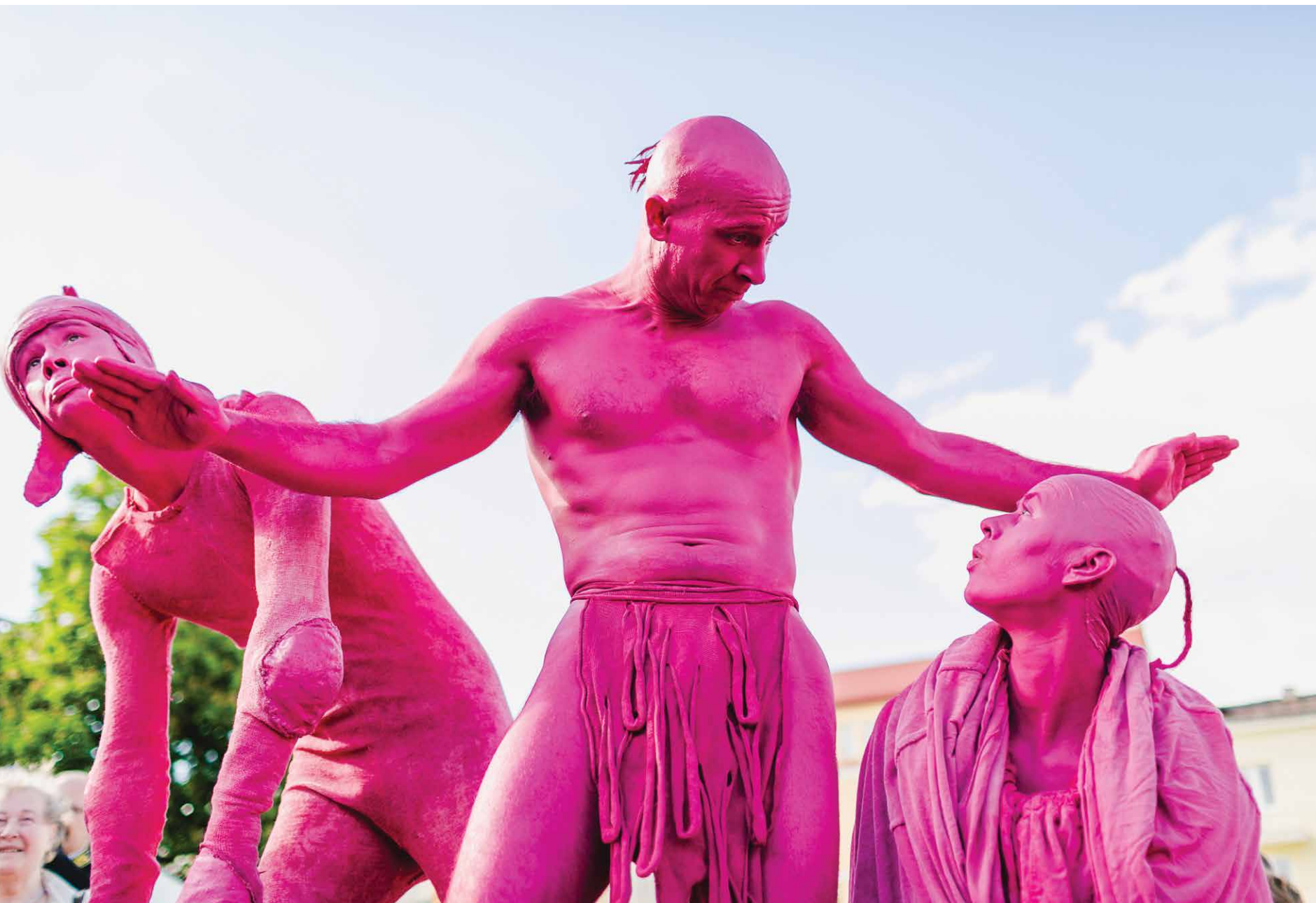
Prezentacja KUD Ljud podczas XXX Dni Sztuki Współczesnej, Białostocki Ośrodek Kultury, 2015