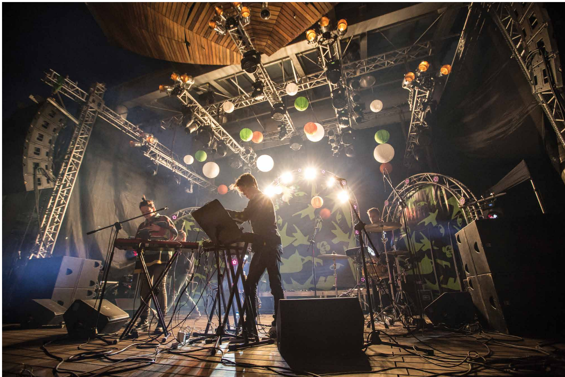
Halfway Festival Białystok 2015, Opera i Filharmonia Podlaska