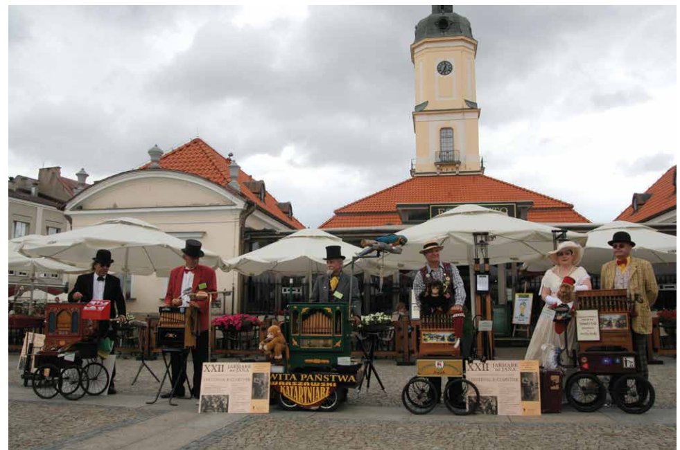
Festiwal Katarynek, Muzeum Podlaskie w Białymstoku