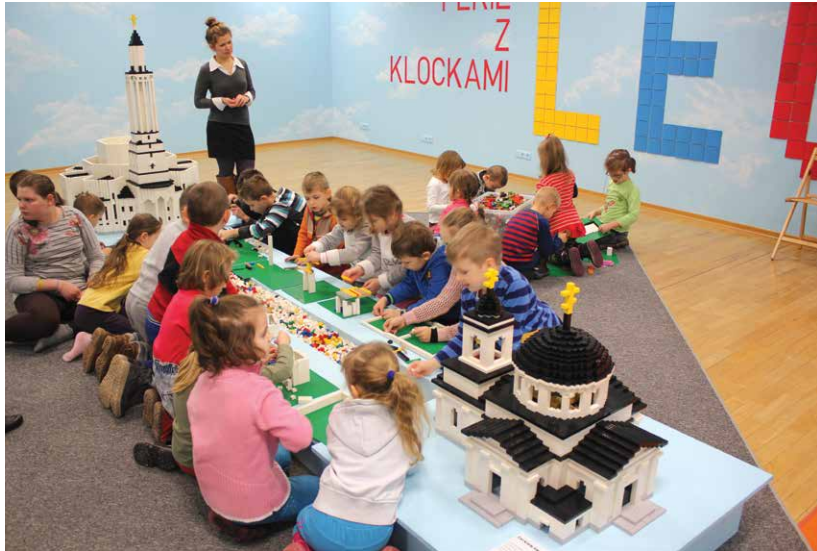
Ferie z klockami LEGO w Centrum im. Ludwika Zamenhofa, 2015