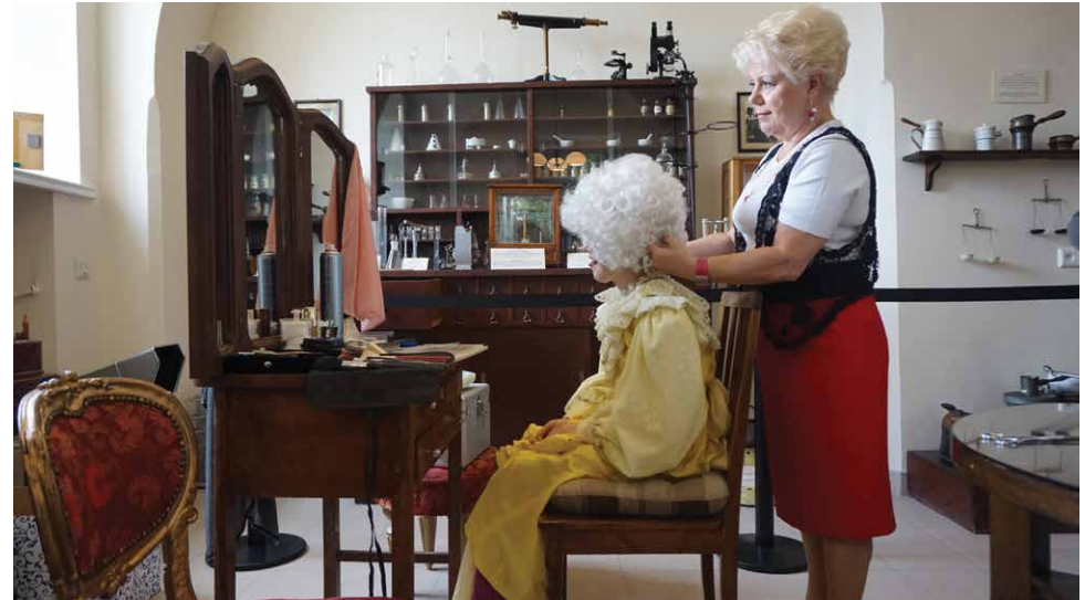
CLZ na Dni Miasta Białegostoku – Opis obyczajów za czasów Izabeli Branickiej, Muzeum Historii Medycyny i Farmacji Uniwersytetu Medycznego w Białymstoku