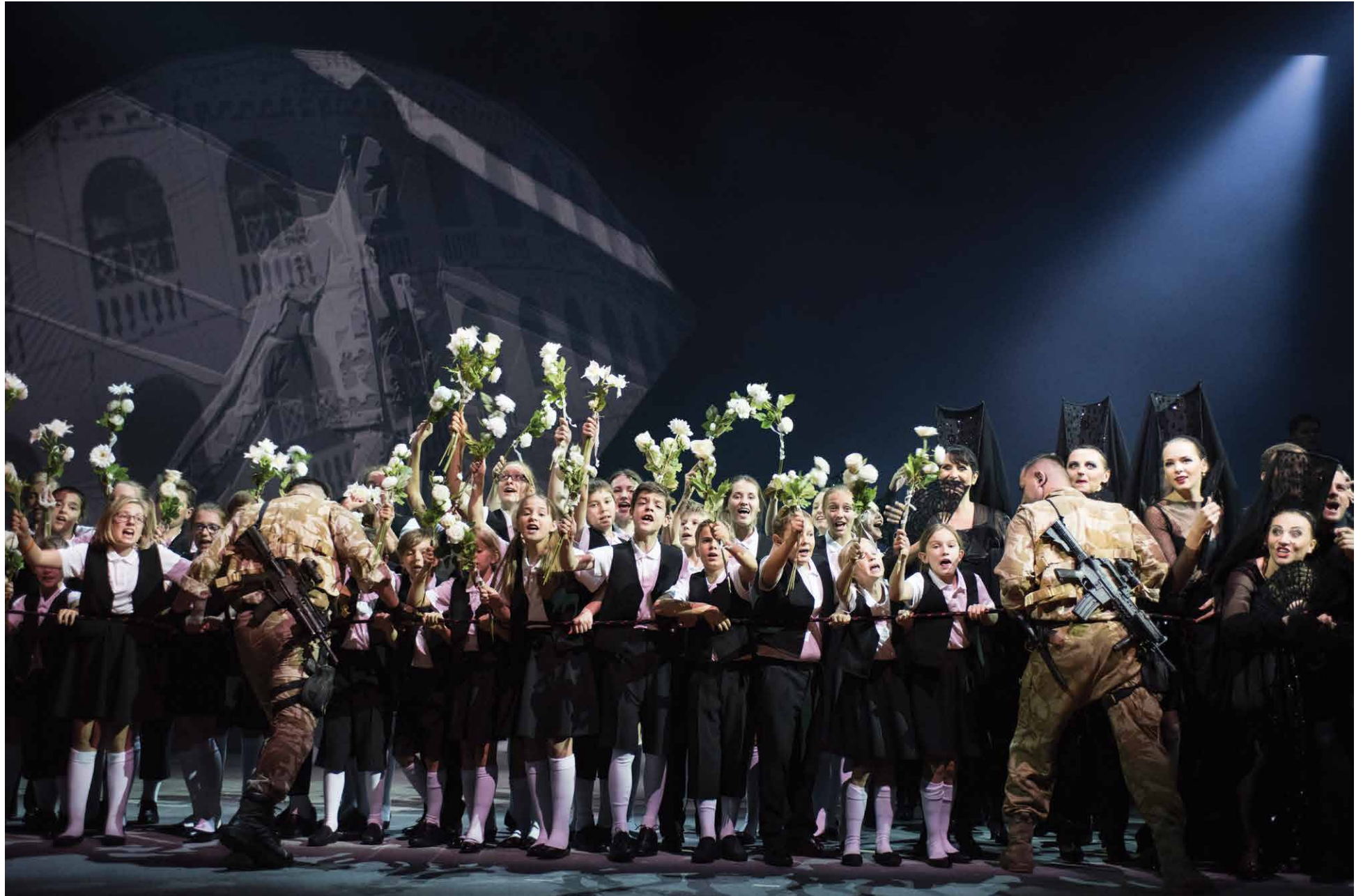
Opera „Carmen”, Opera i Filharmonia Podlaska