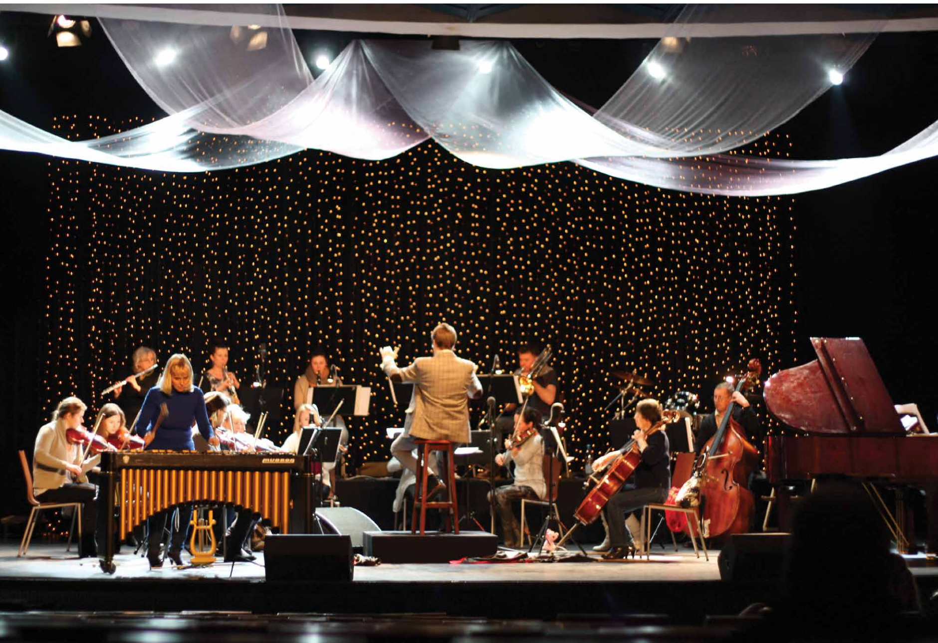
Koncert sylwestrowy w Białostockim Ośrodku Kultury, Białystok 2014