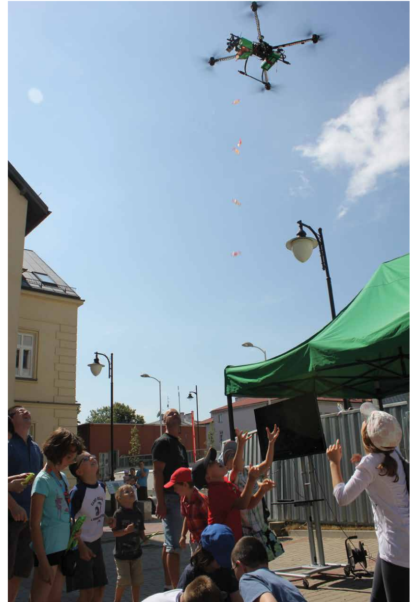
Urodziny CLZ – Odlotowy Festyn, Centrum im. Ludwika Zamenhofa, Białystok 2015