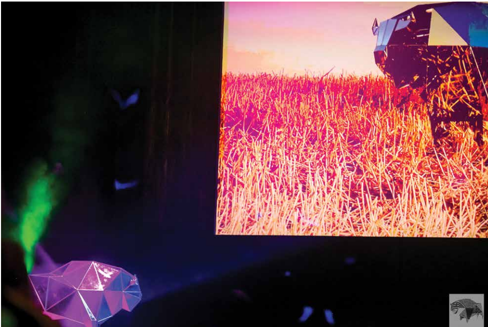
Festiwal Żubroffka, Białostocki Ośrodek Kultury, 2014