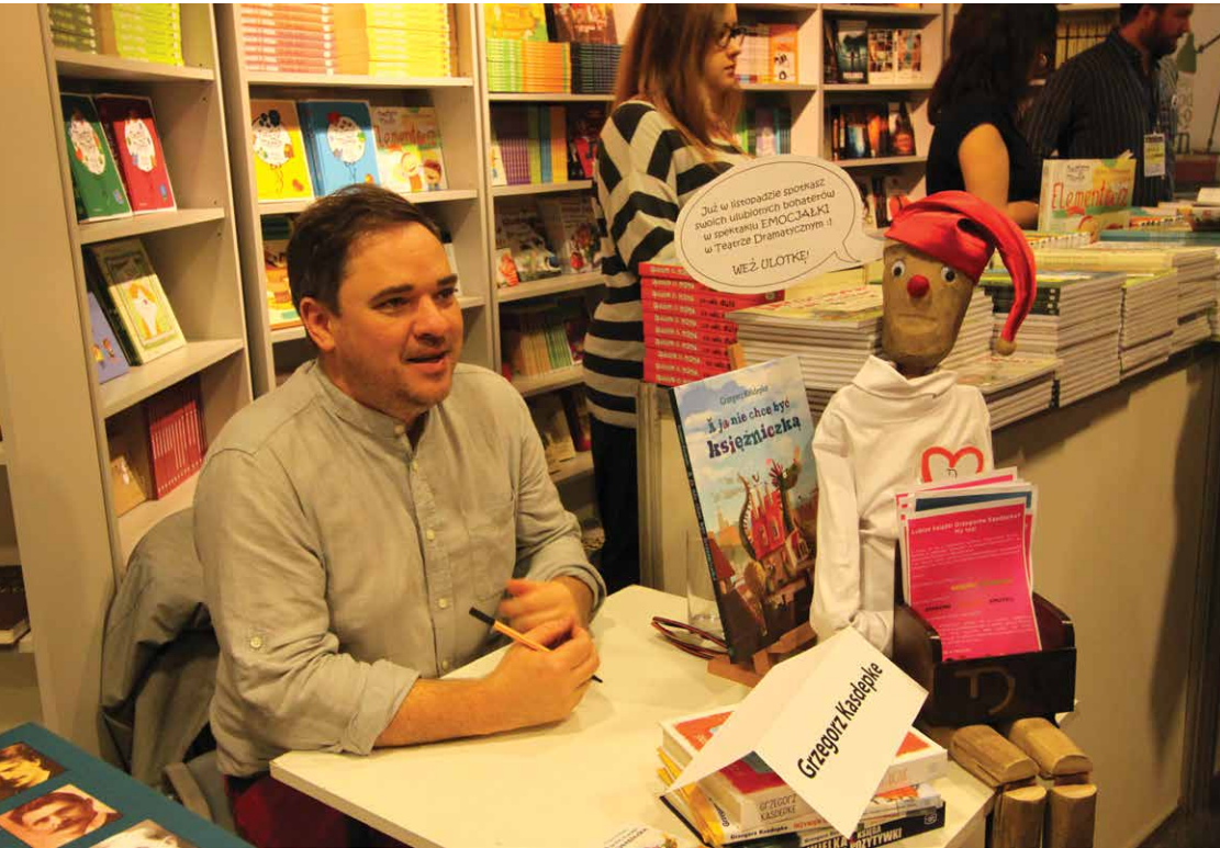
Międzynarodowe Targi Książki, Opera i Filharmonia Podlaska, Białystok 2015