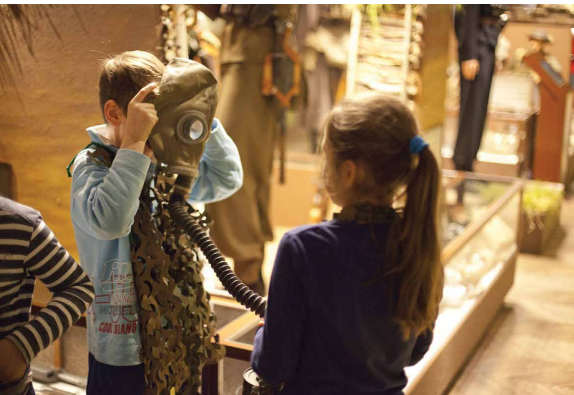
Zajęcia edukacyjne w Muzeum Wojska, Białystok 2015