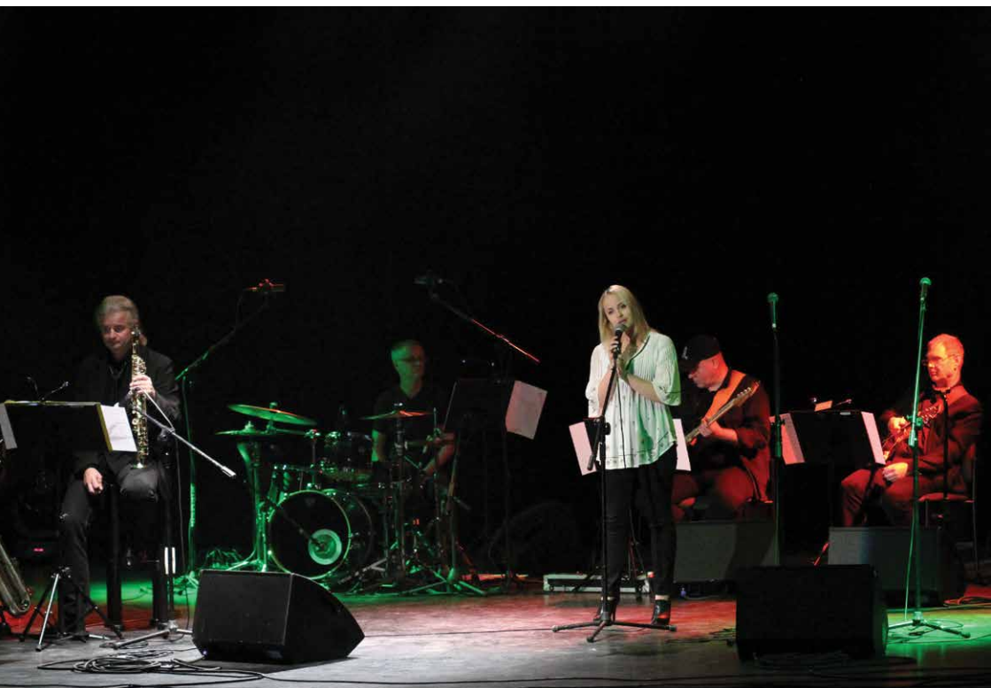
Festiwal Piosenki Literackiej im. Łucji Prus, Wojewódzki Ośrodek Animacji Kultury, Białystok 2015