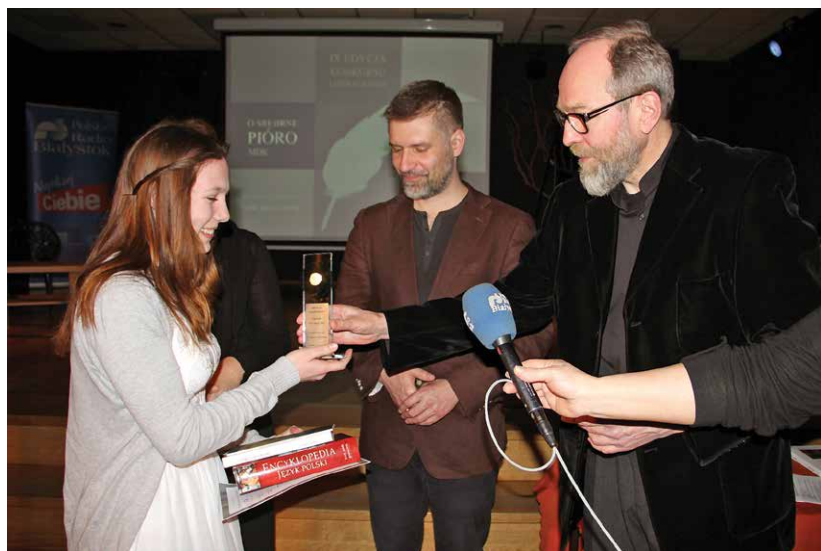
Konkurs poetycki „O srebrne Pióro MDK”, Młodzieżowy Dom Kultury, 2015 (fot. archiwum MDK)