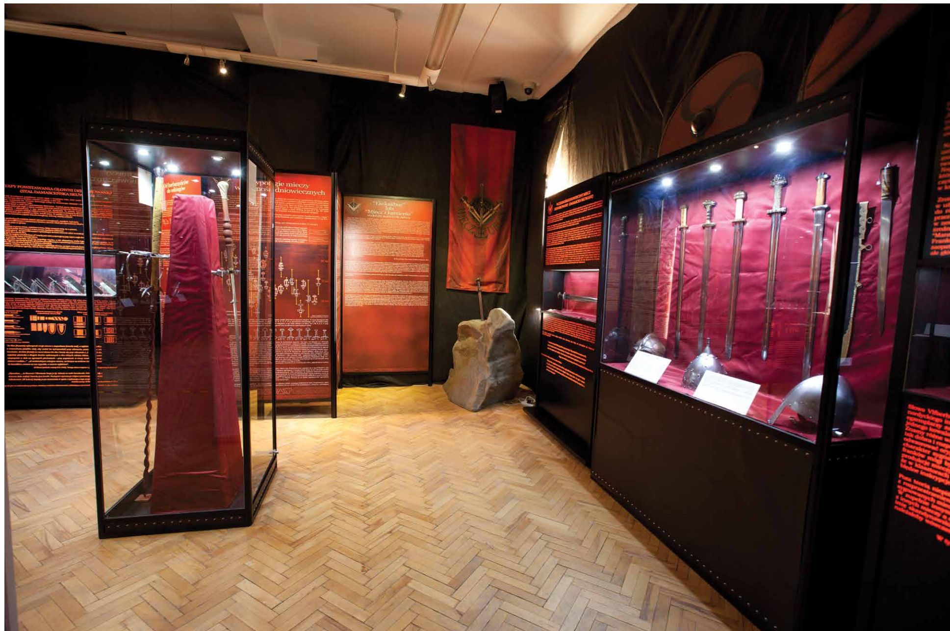
Wystawa „Miecz Europey” w Muzeum Wojska, Białystok 2015