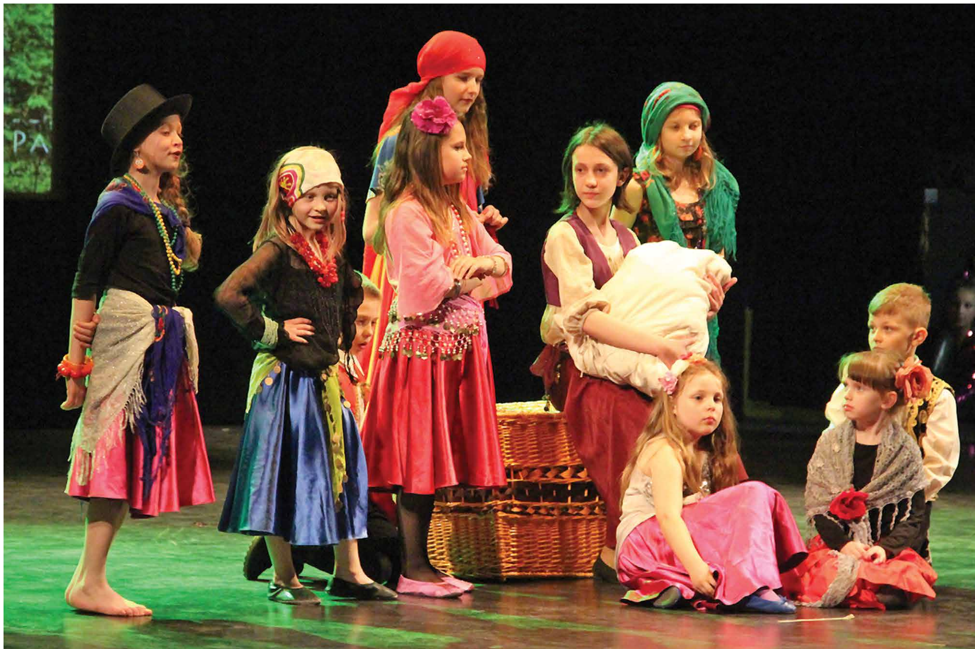
Prezentacje podczas „Wiosny Artystycznej” w Młodzieżowym Domu Kultury, Białystok 2015