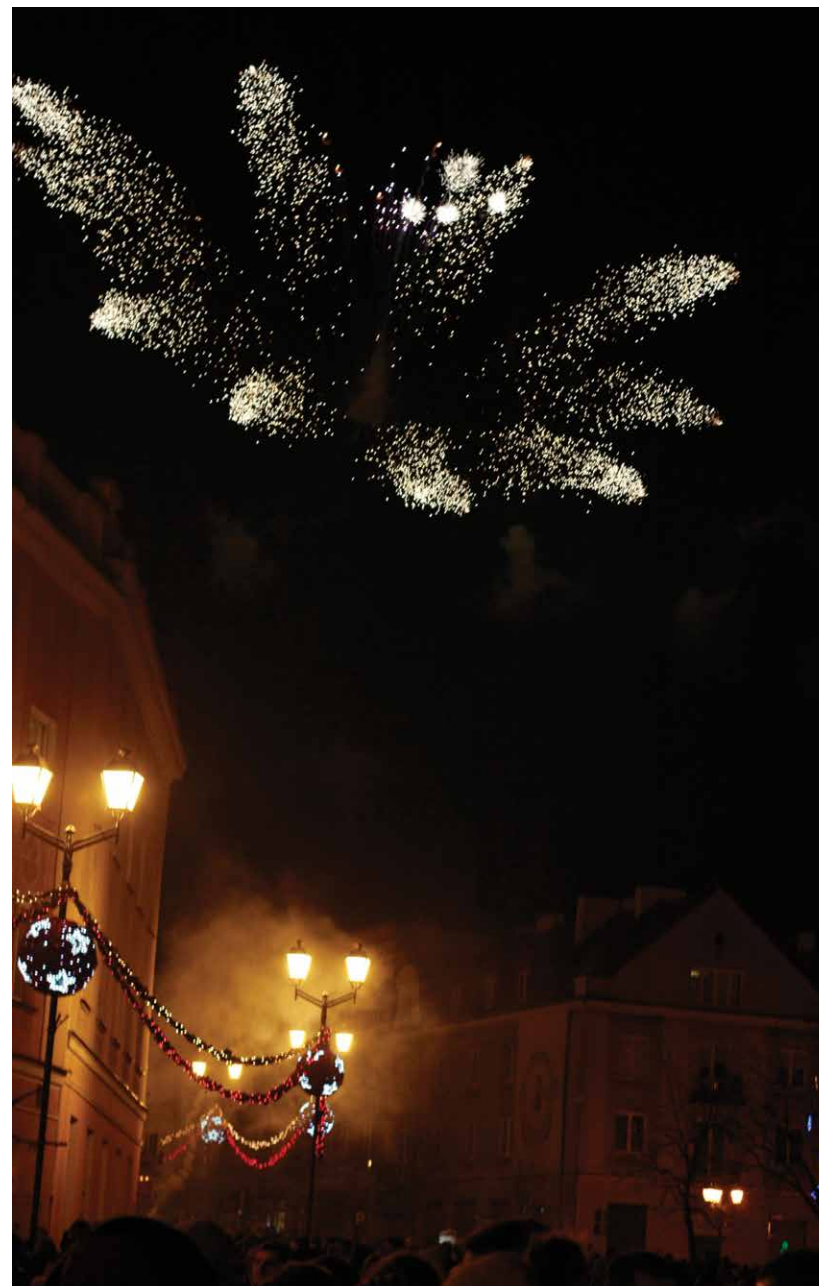
Sylwester Miejski, Białostocki Ośrodek Kultury