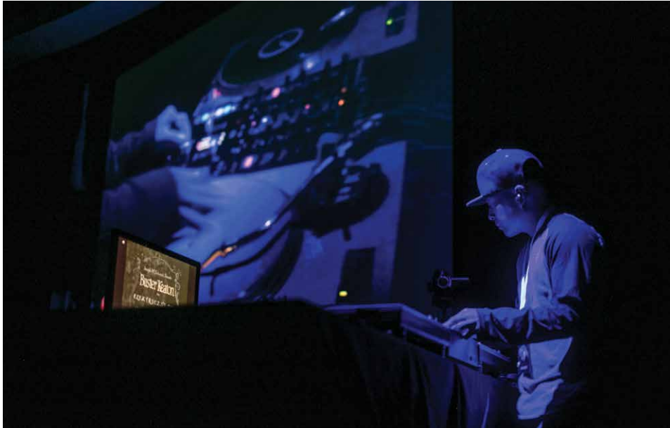
Festiwal Żubroffka, Białostocki Ośrodek Kultury, 2014