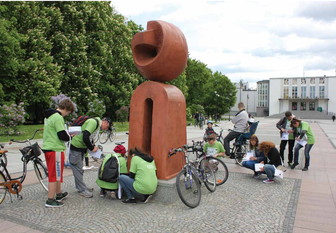
Monumentalna Gra Miejska - Poznaj Białystok 2015, Centrum im. Ludwika Zamenhofa