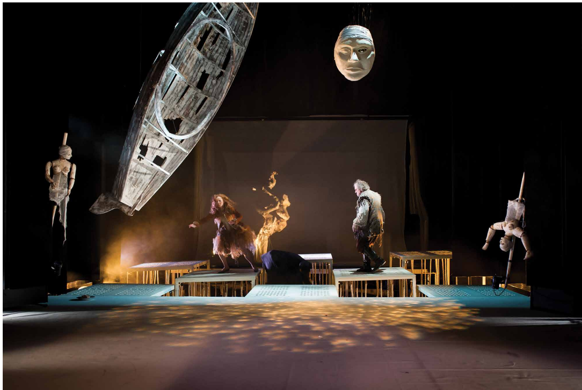
Spektakl „Burza” w Białostockim Teatrze Lalek, 2015