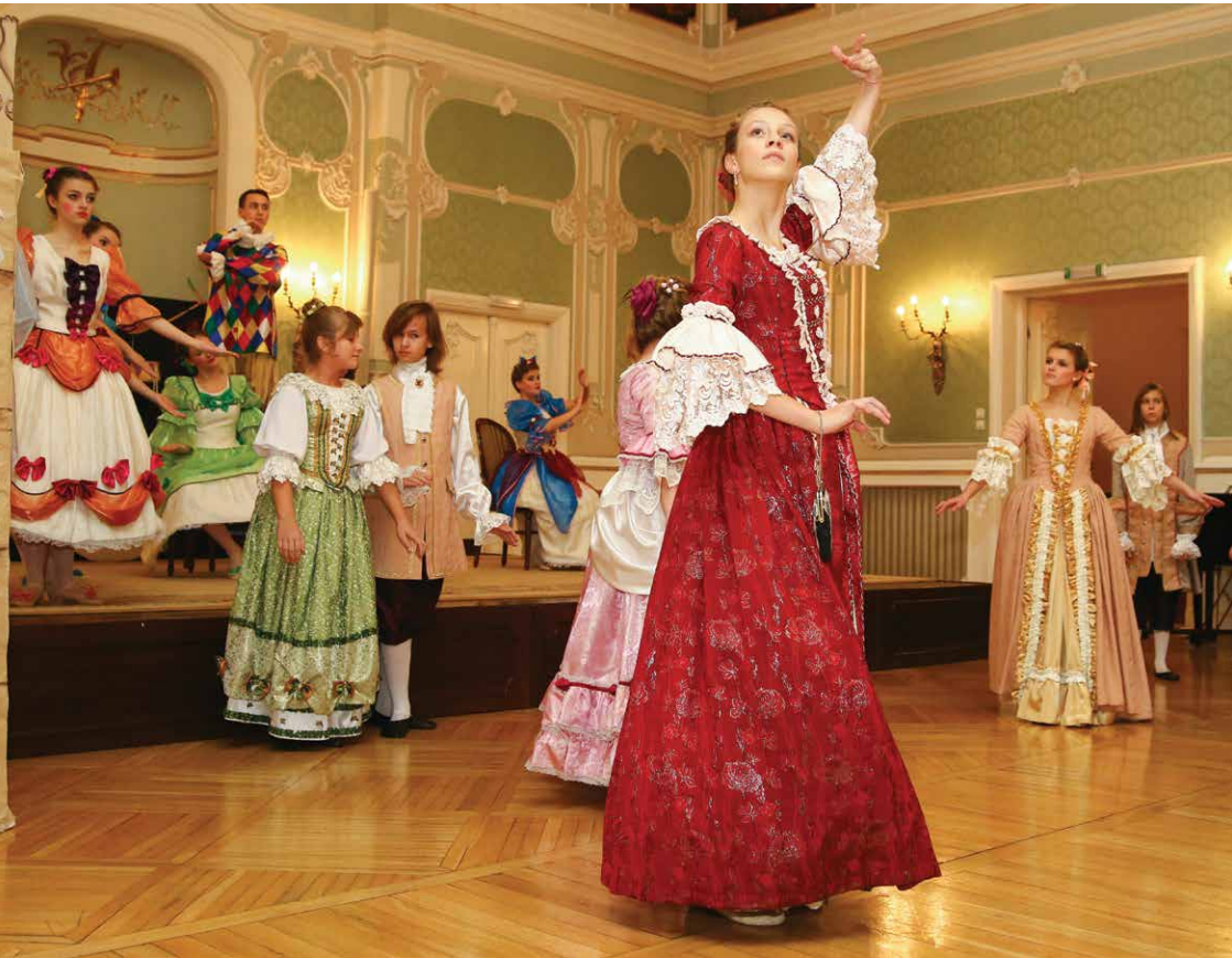
Dzień Muzyki i Tańca Dworskiego, Dom Kultury „Śródmieście”, 2015