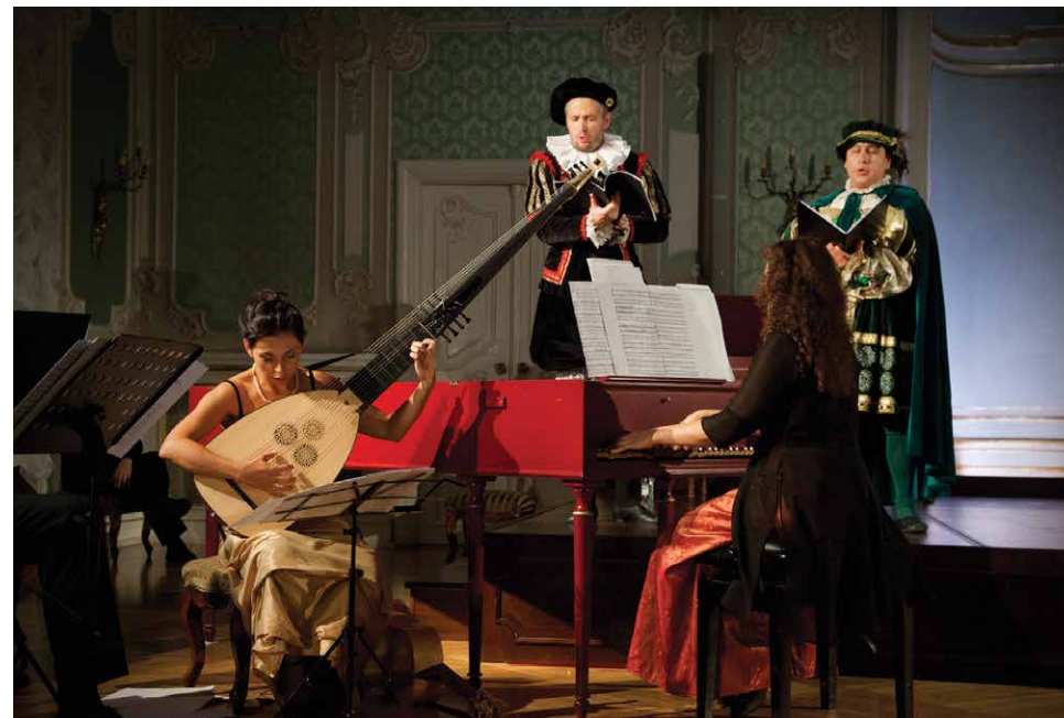
VII Międzynarodowy Festiwal Muzyki Dawnej im. Julitty Sleńdzińskiej, Galeria im. Sleńdzińskich, Białystok 2015