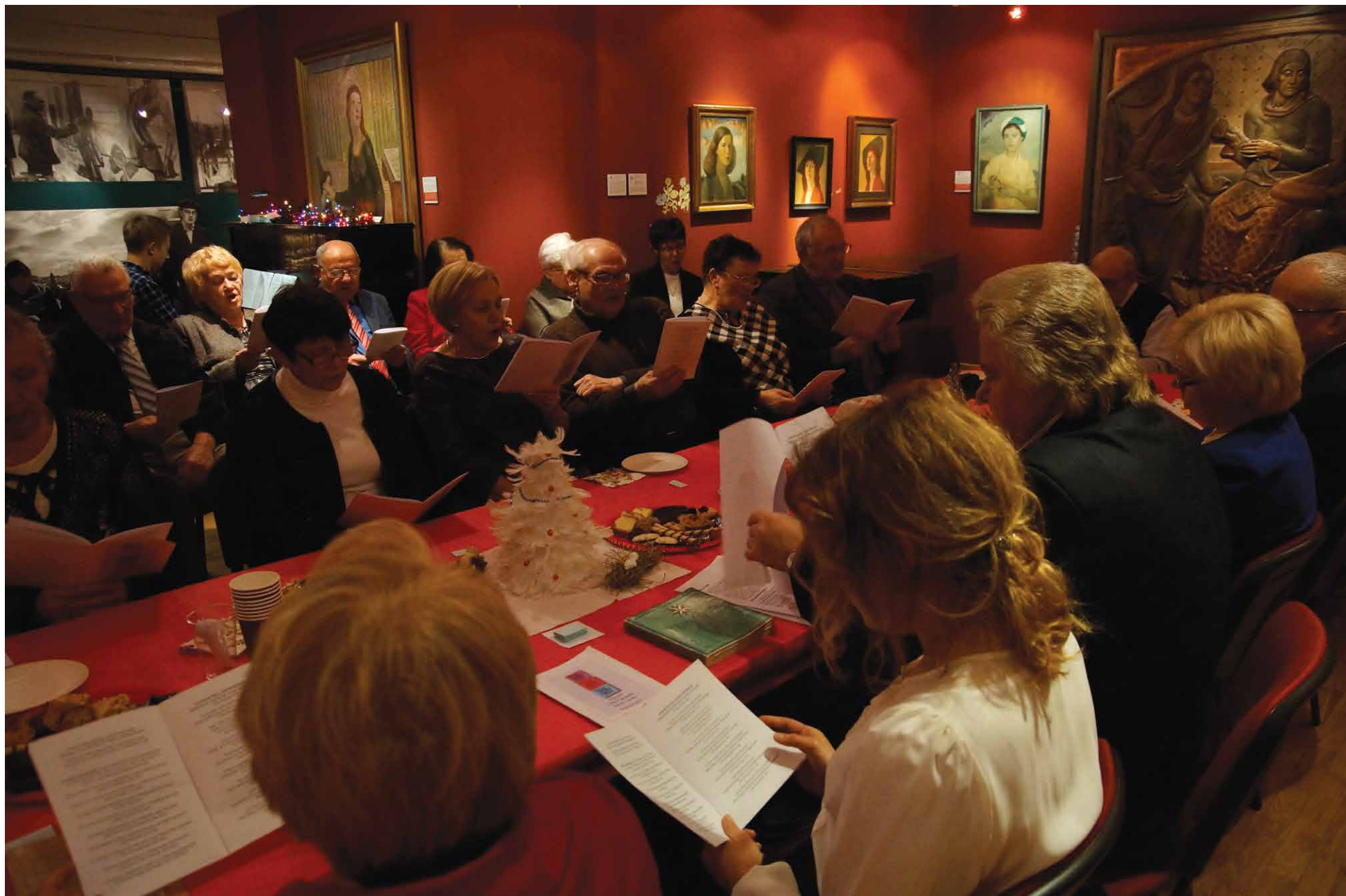
Wspólne śpiewanie pieśni patriotycznych w Galerii im. Sleńdzińskich