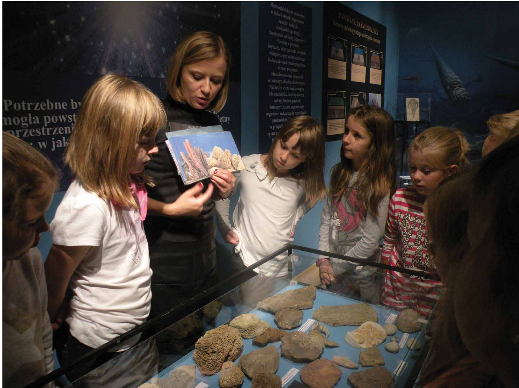
Tydzień Dziecka 2015 w Muzeum Podlaskim w Białymstoku