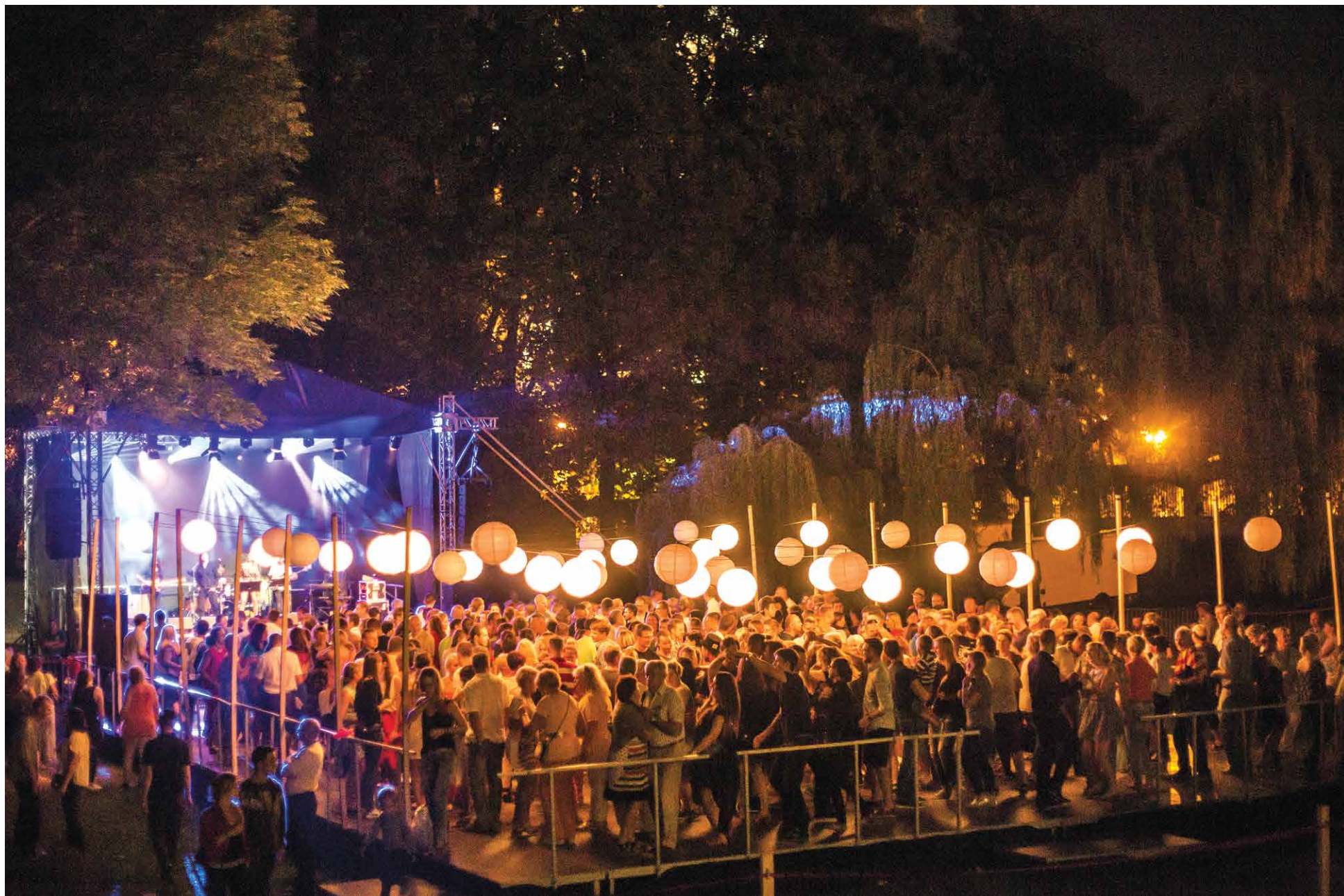
Potańcówka, Wschód Kultury / Inny Wymiar, Białystok 2015 (fot. T. Pienicki)