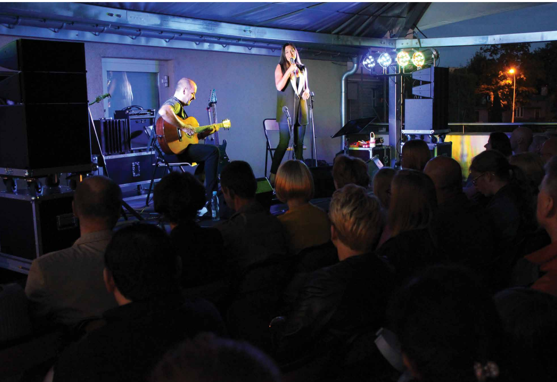
„Jazz w CLZ” na tarasach Centrum im. Ludwika Zamenhofs, Białystok 2015