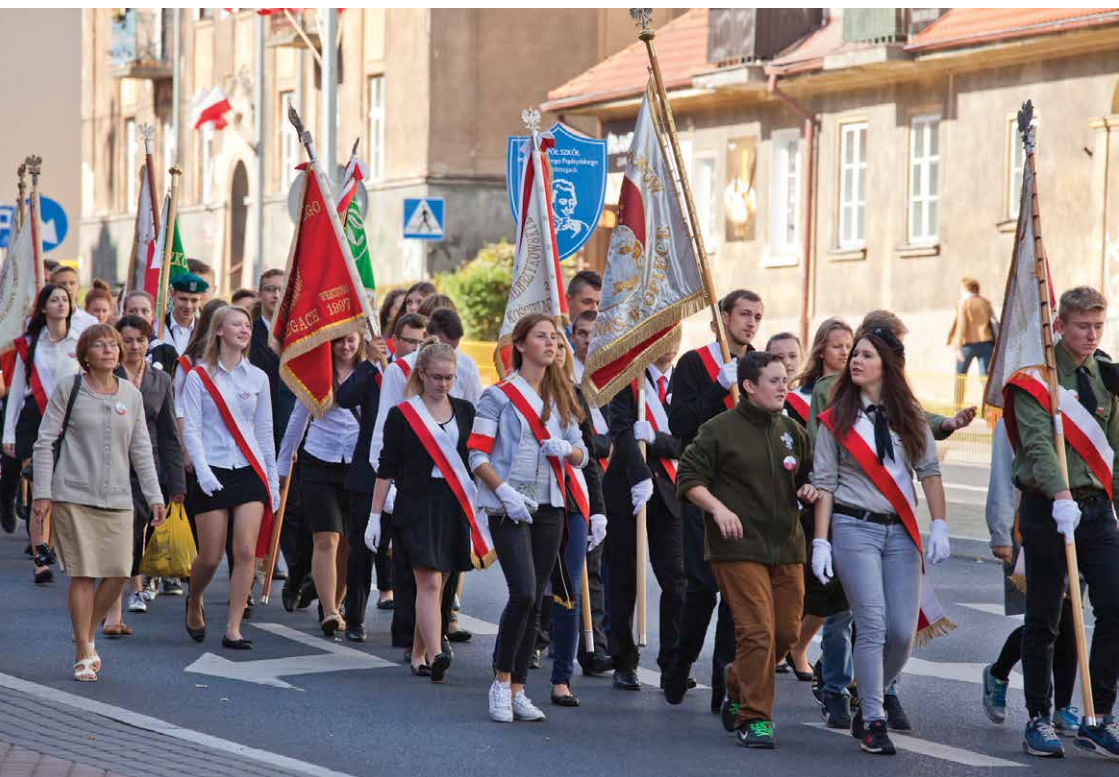
XV Międzynarodowy Marsz Żywej Pamięci Polskiego Sybiru, Białystok 2015