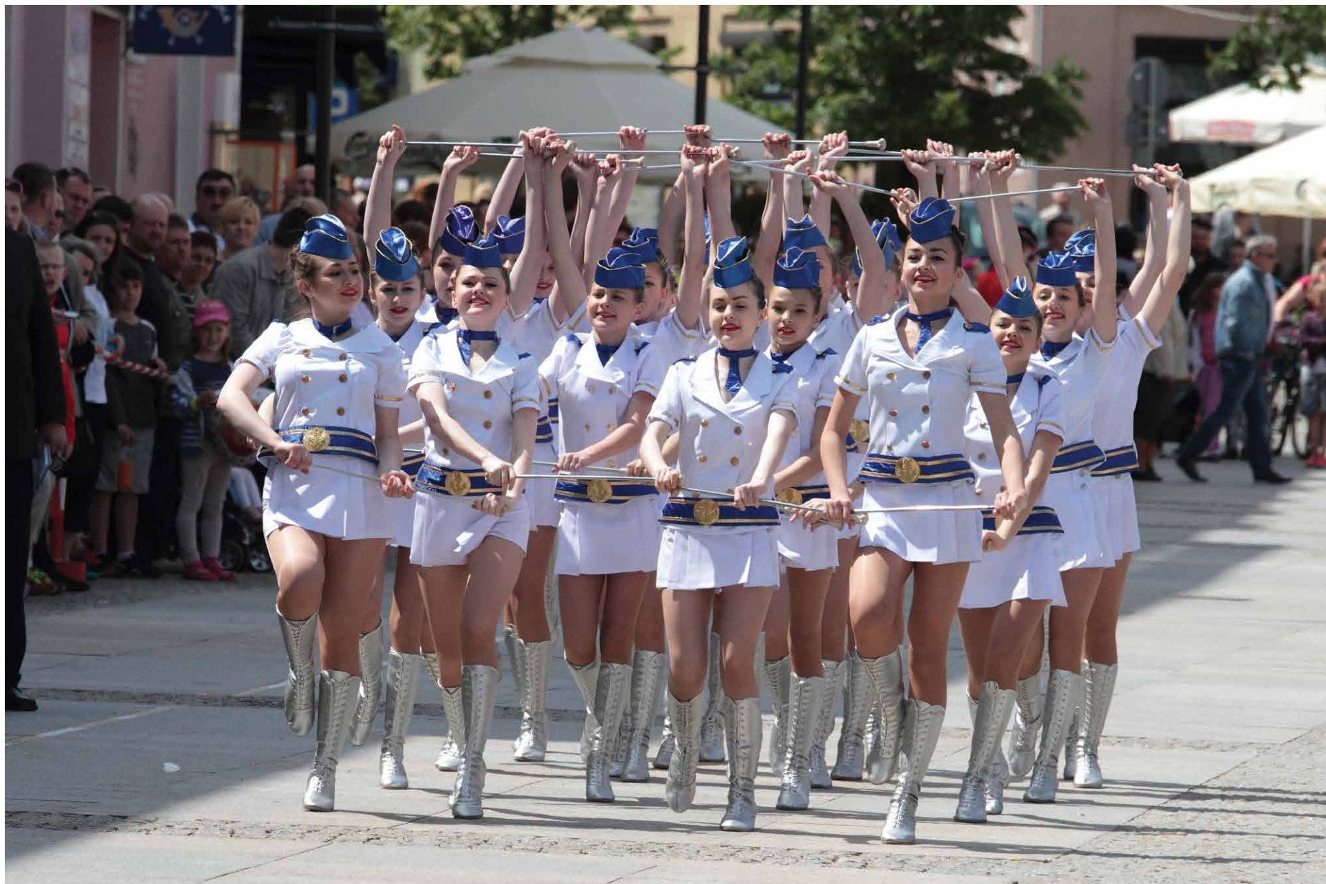
Występ formacji Holiday z Baranowicz na Białorusi, POM-PA 2015, Białystok 2015