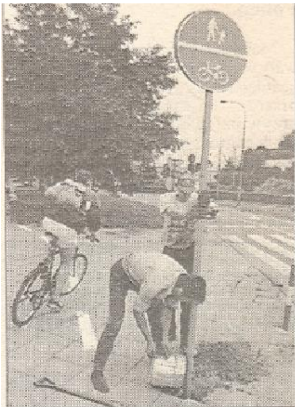
Wczoraj przy ścieżce instalowano znak drganowe