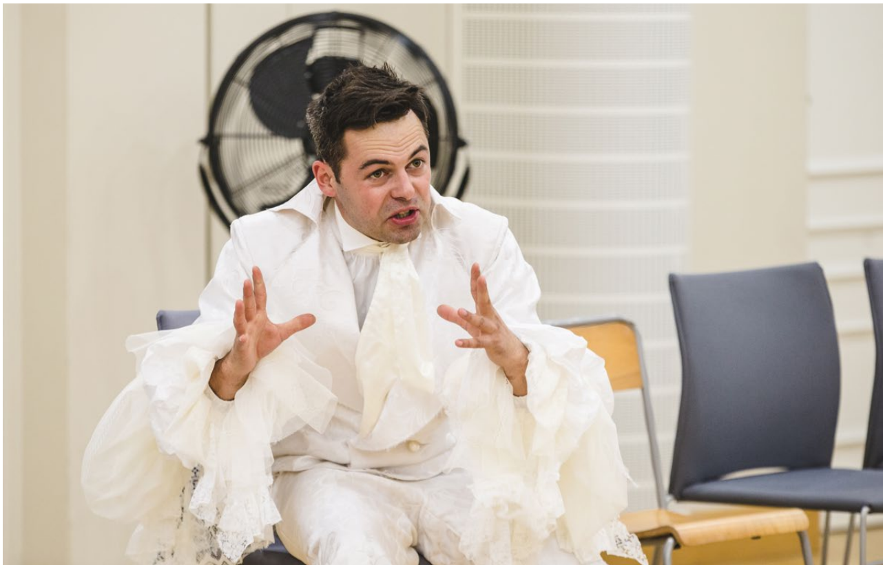
Art Weekend , Białystok 2020