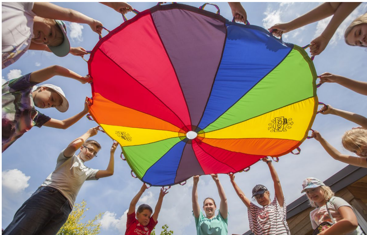
Wakacje z Muzeum Wojska w Białymstoku, 2020