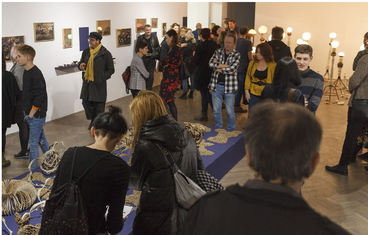
Wystawa Retrogradacja w Galerii Arsenał w Białymstoku, 2020