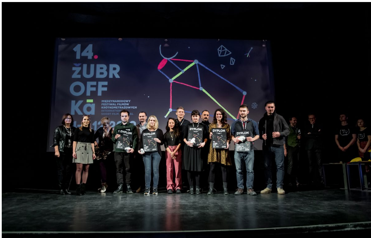
14. Międzynarodowy Festiwal Filmów Krótkometrażowych ŻubrOffka , Białostocki Ośrodek Kultury, 2019