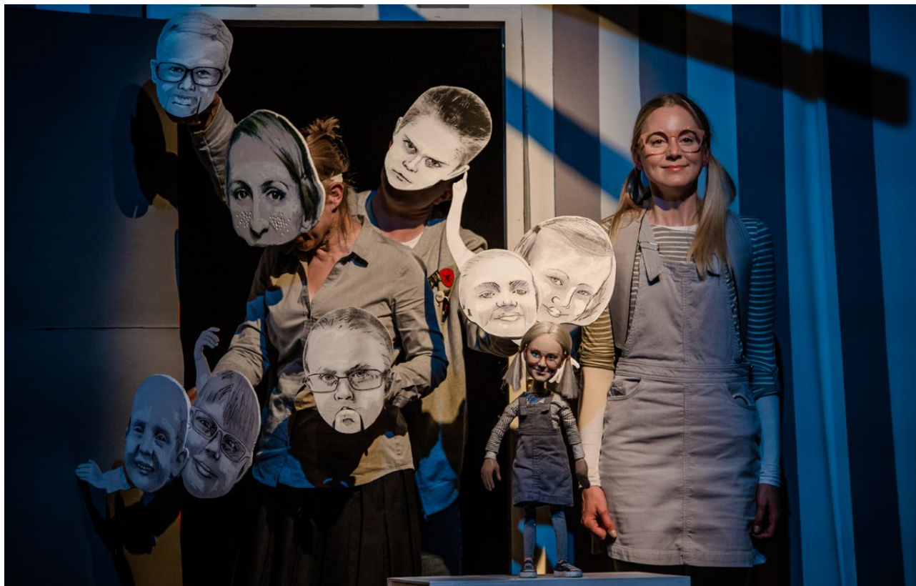
Dni Sztuki Współczesnej, Białystok 2019