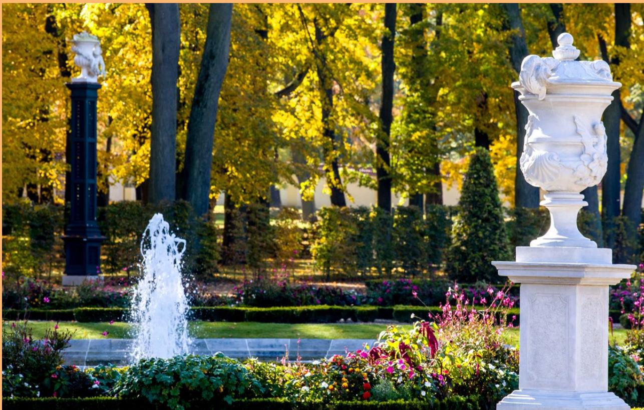
Jesień w Ogrodzie Branickich w Białymstoku