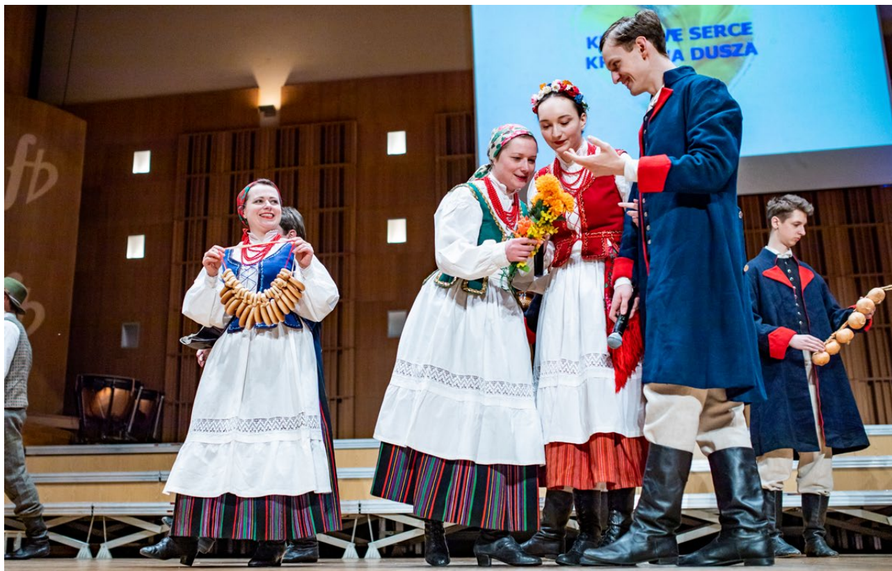
XXI Dni Kultury Kresowej, Towarzystwo Przyjaciół Grodna i Wilna Oddział w Białymstoku, 2020