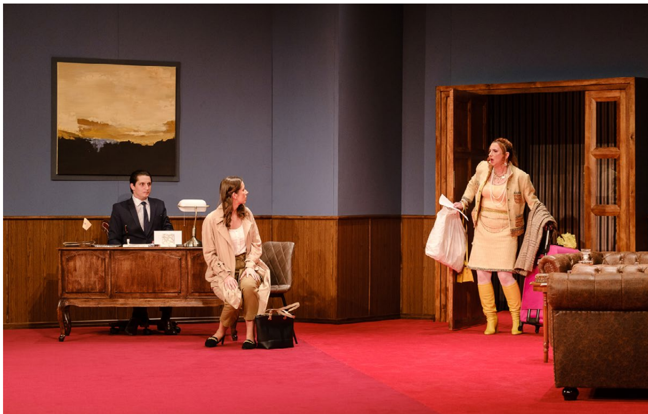
Spektakl Naprzód, Freedomio! w Teatrze Dramatycznym w Białymstoku, 2020