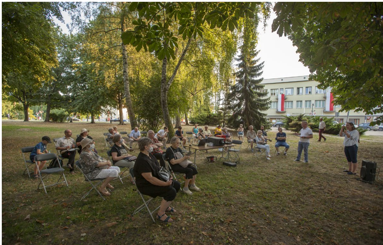
Święto Wojska Polskiego w Muzeum Wojska w Białymstoku, 2020