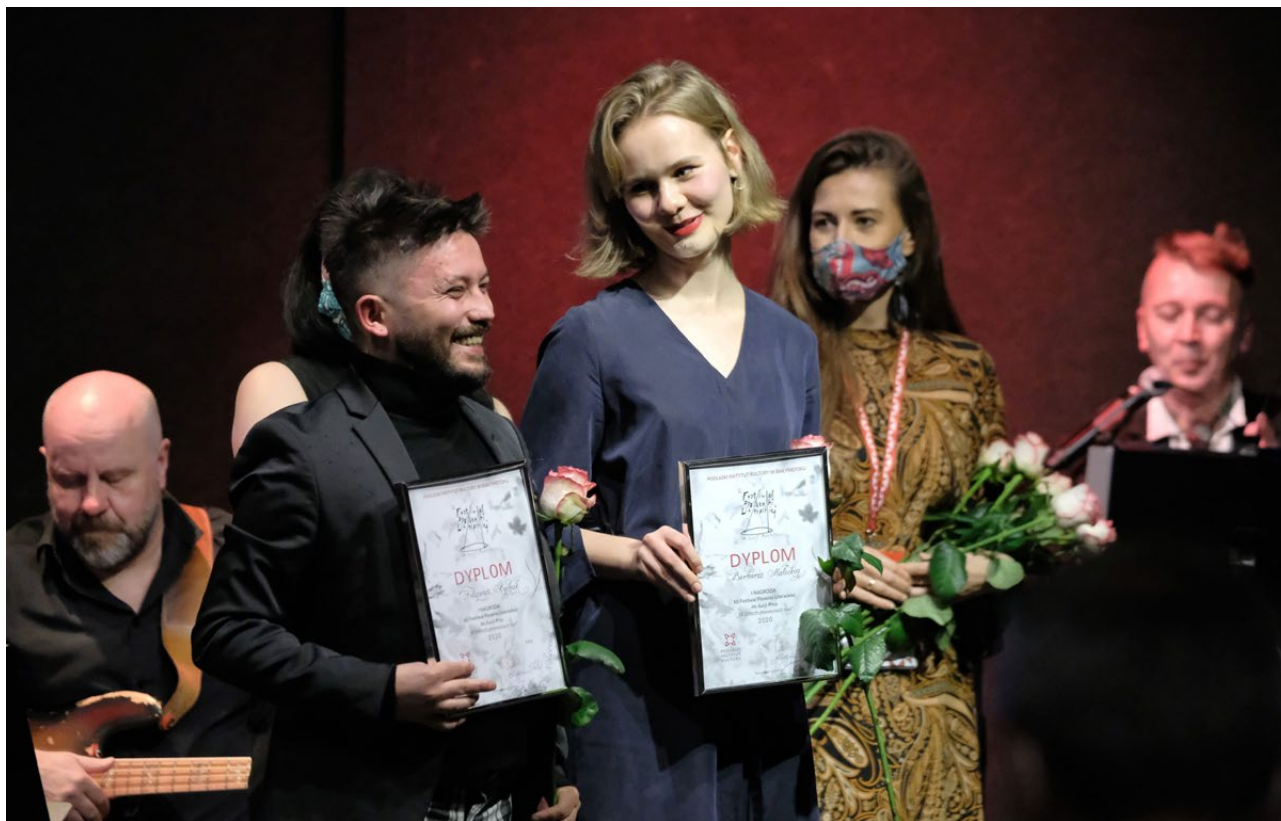
Festiwal Piosenki Literackiej im. Łucji Prus W żółtych płomieniach liści , Podlaski Instytut Kultury, 2020