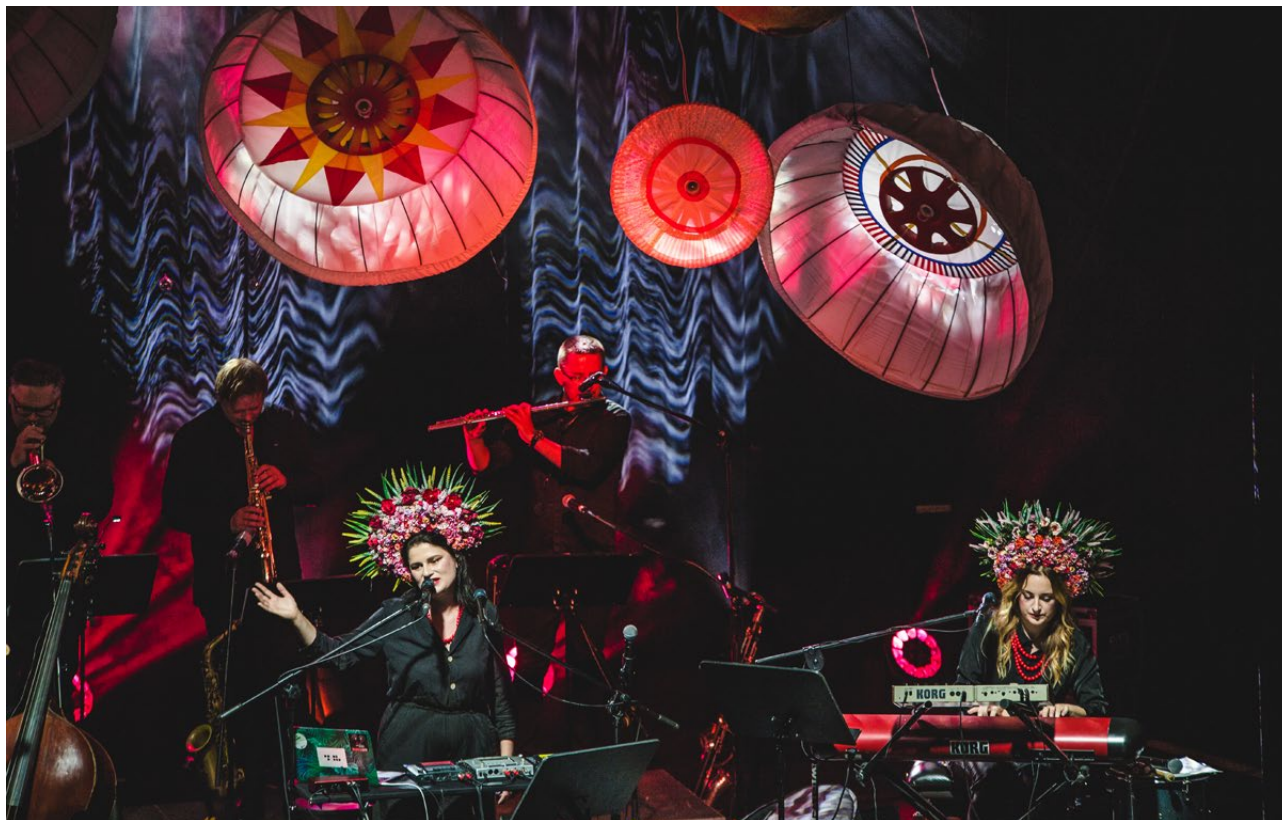
Wschód Kultury / Inny Wymiar, Białystok 2020