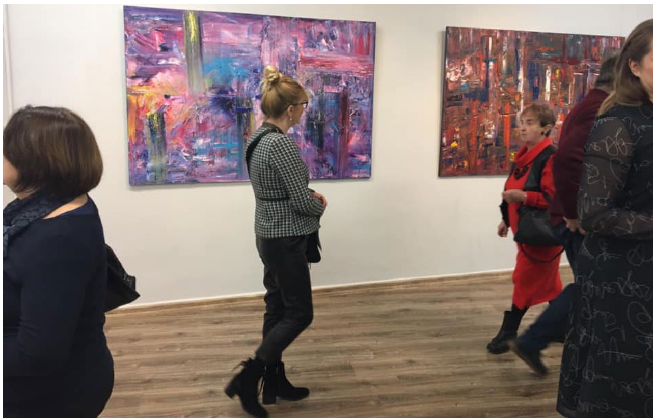
Miejski Salon Artystyczny w Domu Kultury „Śródmieście” w Białymstoku