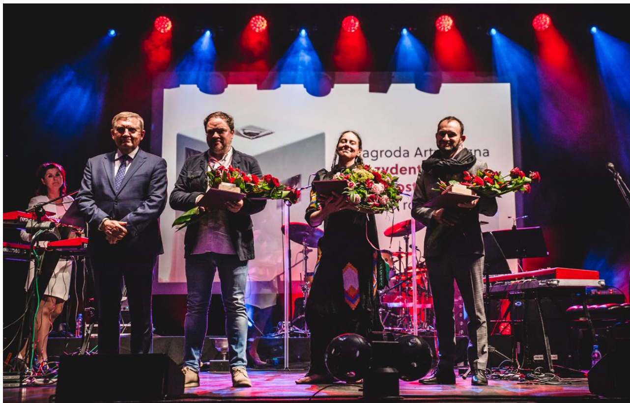
Wręczenie Nagrody Artystycznej Prezydenta Miasta Białegostoku, kino Forum, 2020