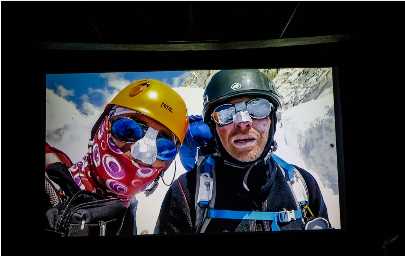
Festiwal Kultur i Podróży Ciekawi Świata , Białostocki Ośrodek Kultury, 2019