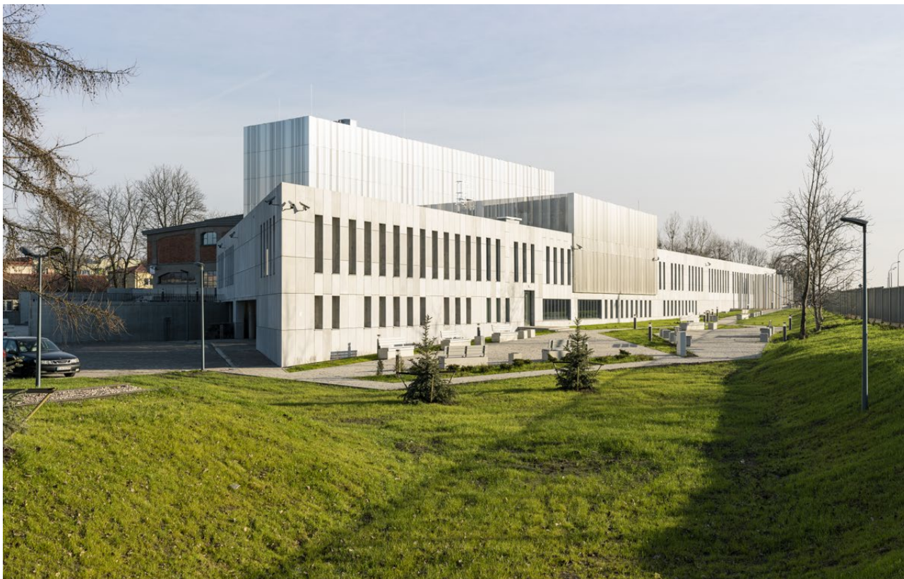
Siedziba Muzeum Pamięci Sybiru w Białymstoku