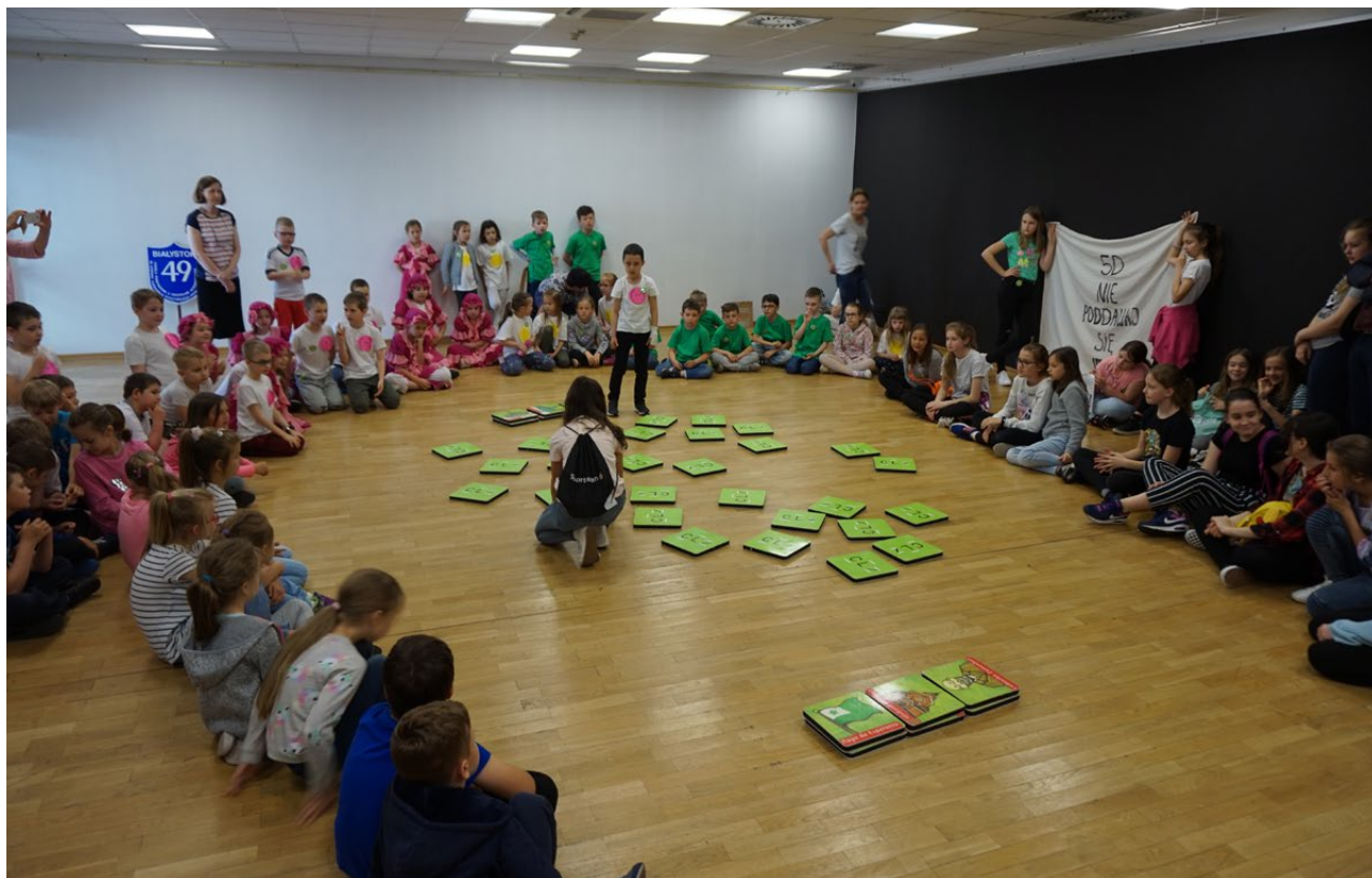
Centralny Turniej Memory, Białystok 2019