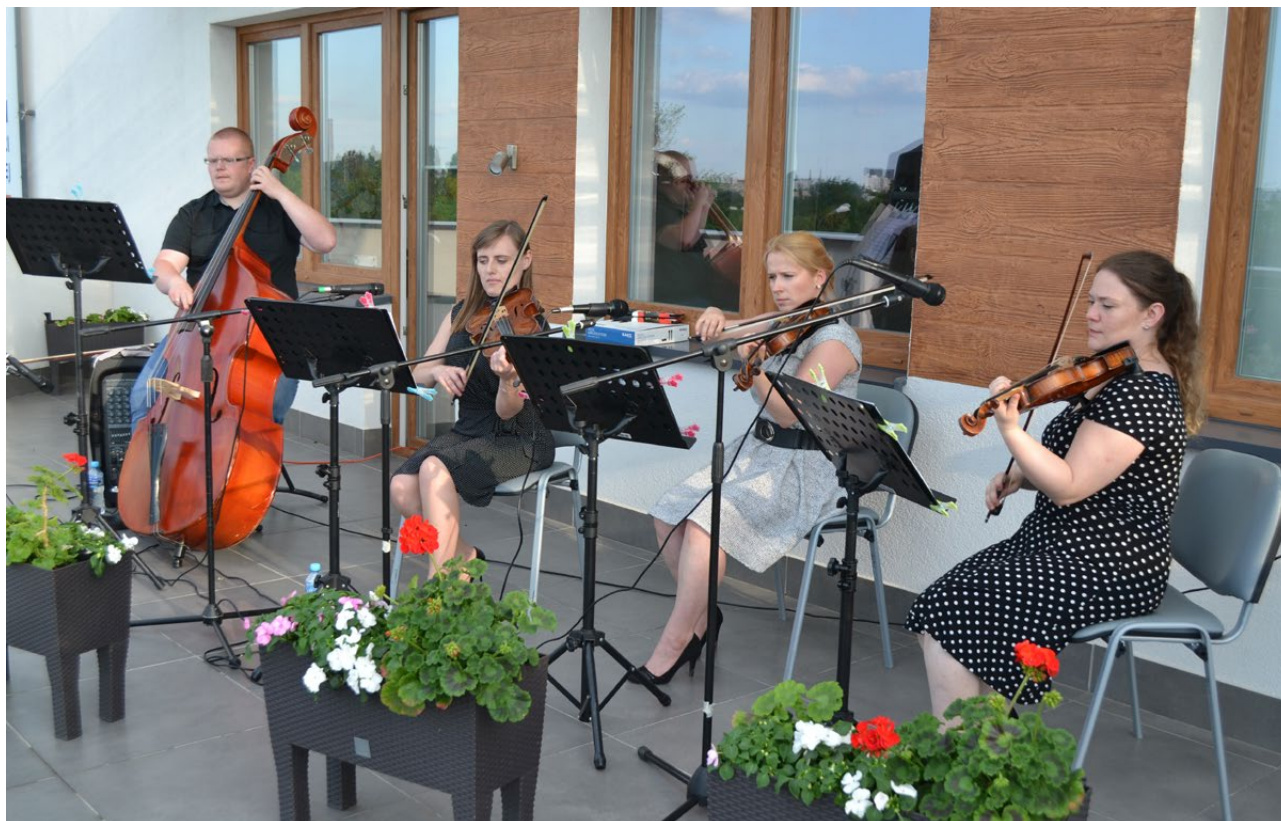
Koncert balkonowy zespołu Kwartet Podlaski - kwartet smyczkowy Białystok , Pracownia Działań Kulturalnych - PSPiA Klanza, 2020