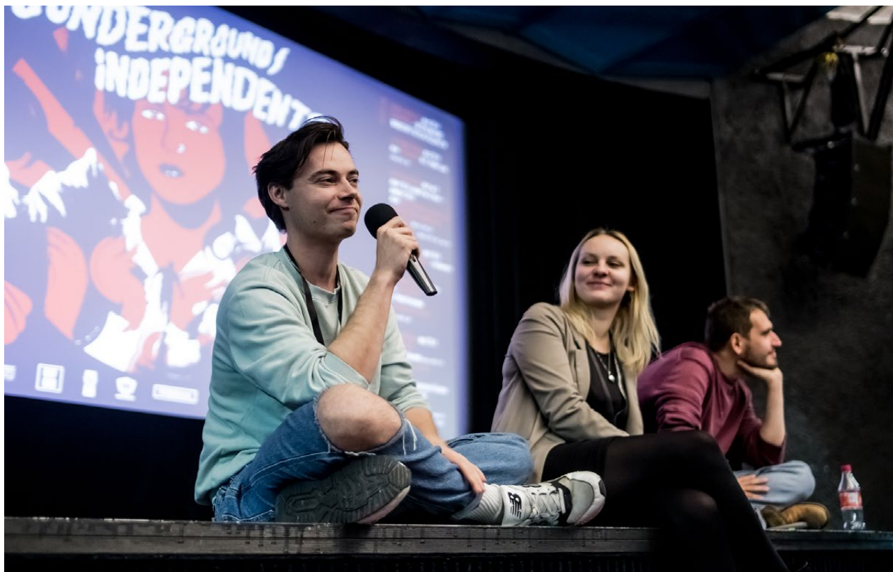
Festiwal Kultury Niezależnej ; Underground/Independent? , Białostocki Ośrodek Kultury, 2020