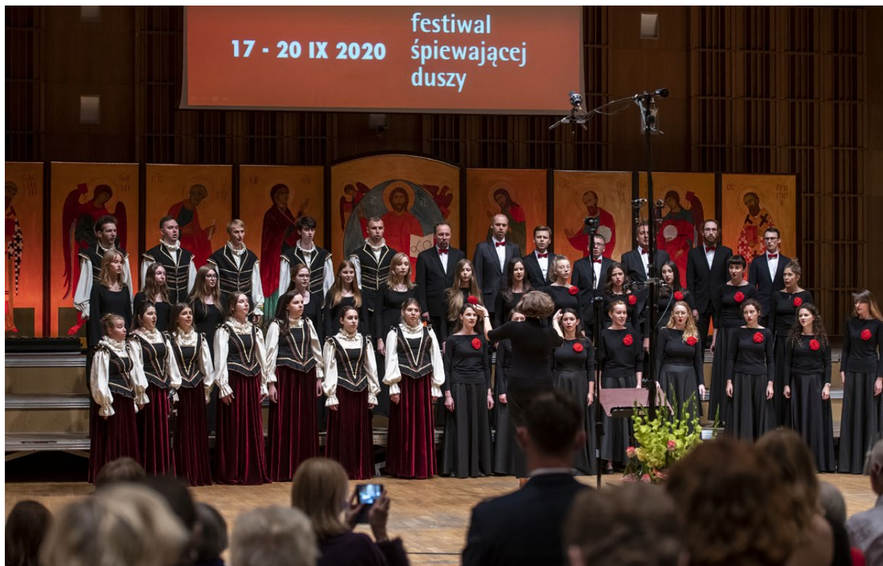
Koncert galowy XXXIX Międzynarodowego Festiwalu Muzyki Cerkiewnej „Hajnówka 2020 w Białymstoku”