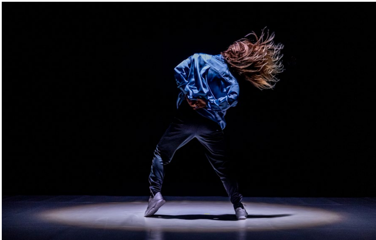
Festiwal Tańca Współczesnego Kalejdoskop , Białystok 2020