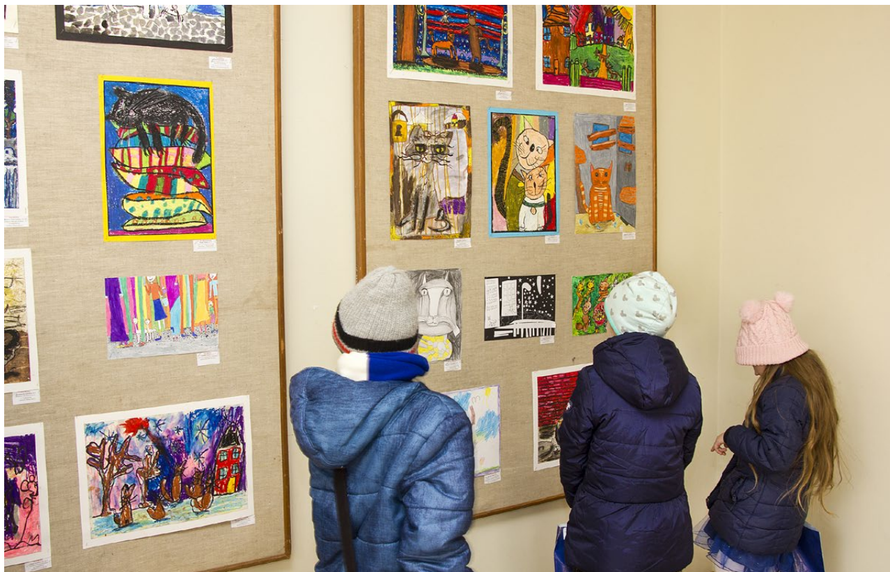
Wystawa prac w ramach konkursu plastyczno-fotograficznego SOS dla bezdomnych kotów w Młodzieżowym Domu Kultury w Białymstoku, 2020