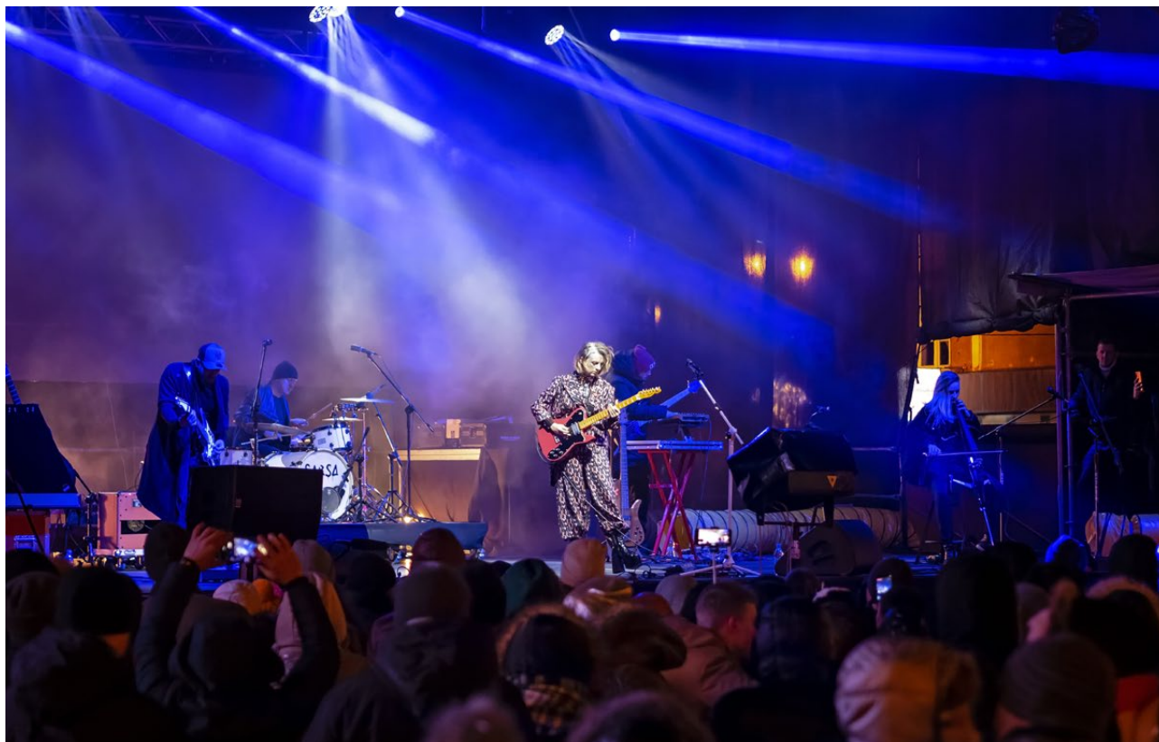
Sylwester Miejski 2019, Rynek Kościuszki