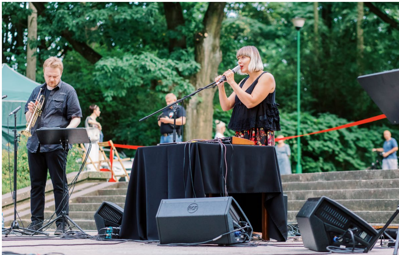
Lato w Mieście, Białystok 2020