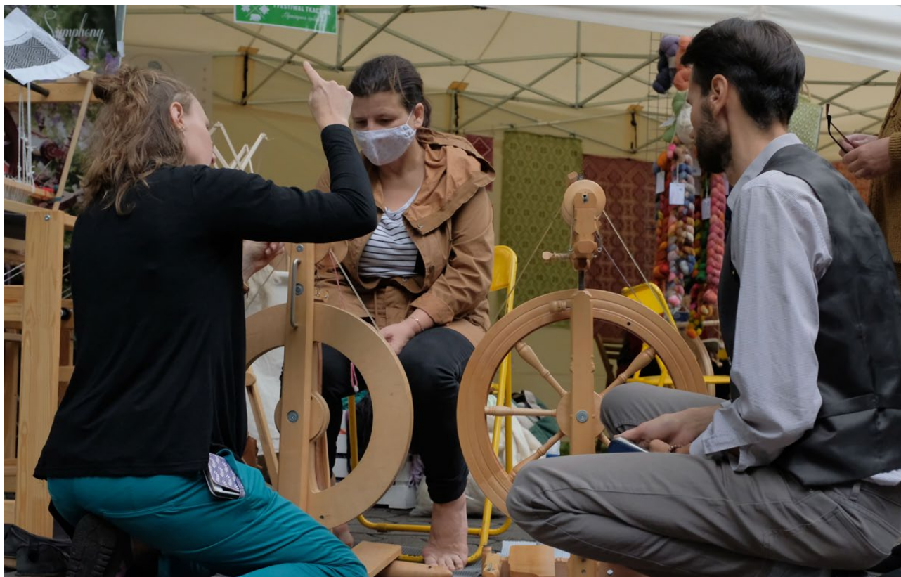
I Festiwal Tkactwa, Podlaski Instytut Kultury w Białymstoku, 2020