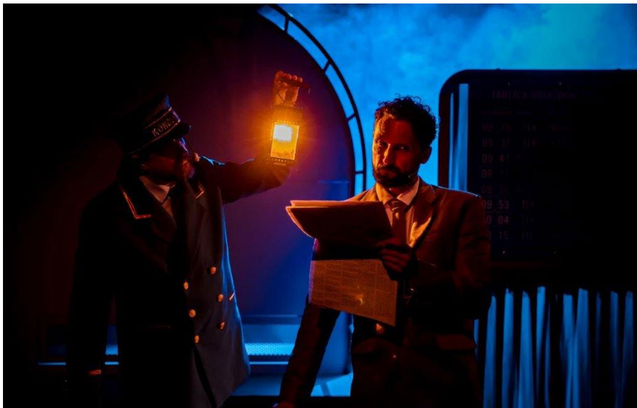
Spektakl Kaszalot w Białostockim Teatrze Lalek, 2020