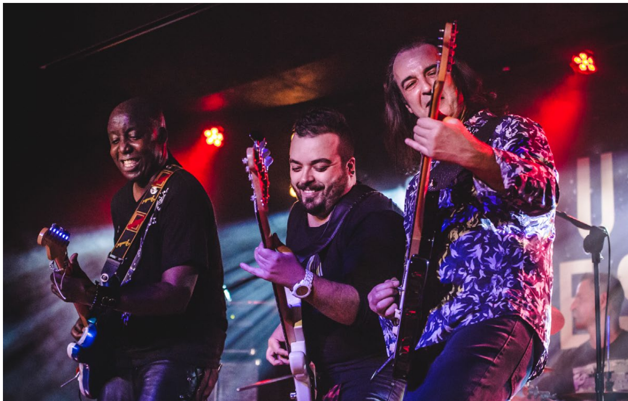
Zaduszki Bluesowe, Białostocki Ośrodek Kultury, 2019