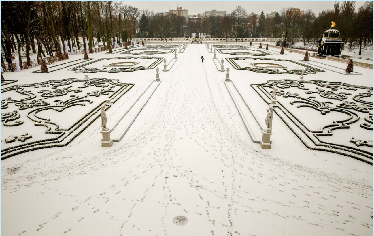
Zima w Ogrodzie Branickich w Białymstoku