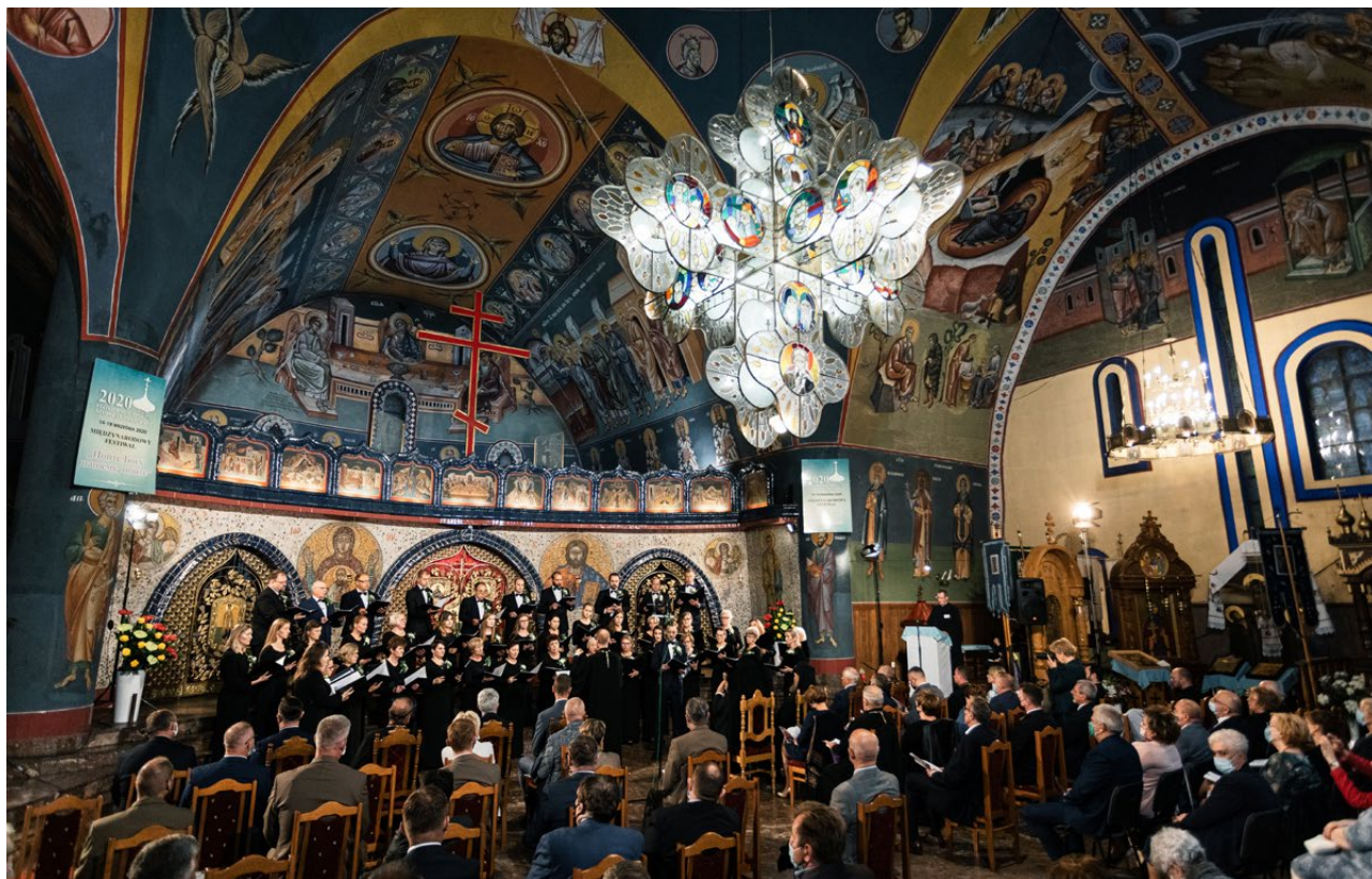
Koncert inauguracyjny XXXIX Międzynarodowego Festiwalu Hajnrowskie Dni Muzyki Cerkiewnej, 2020