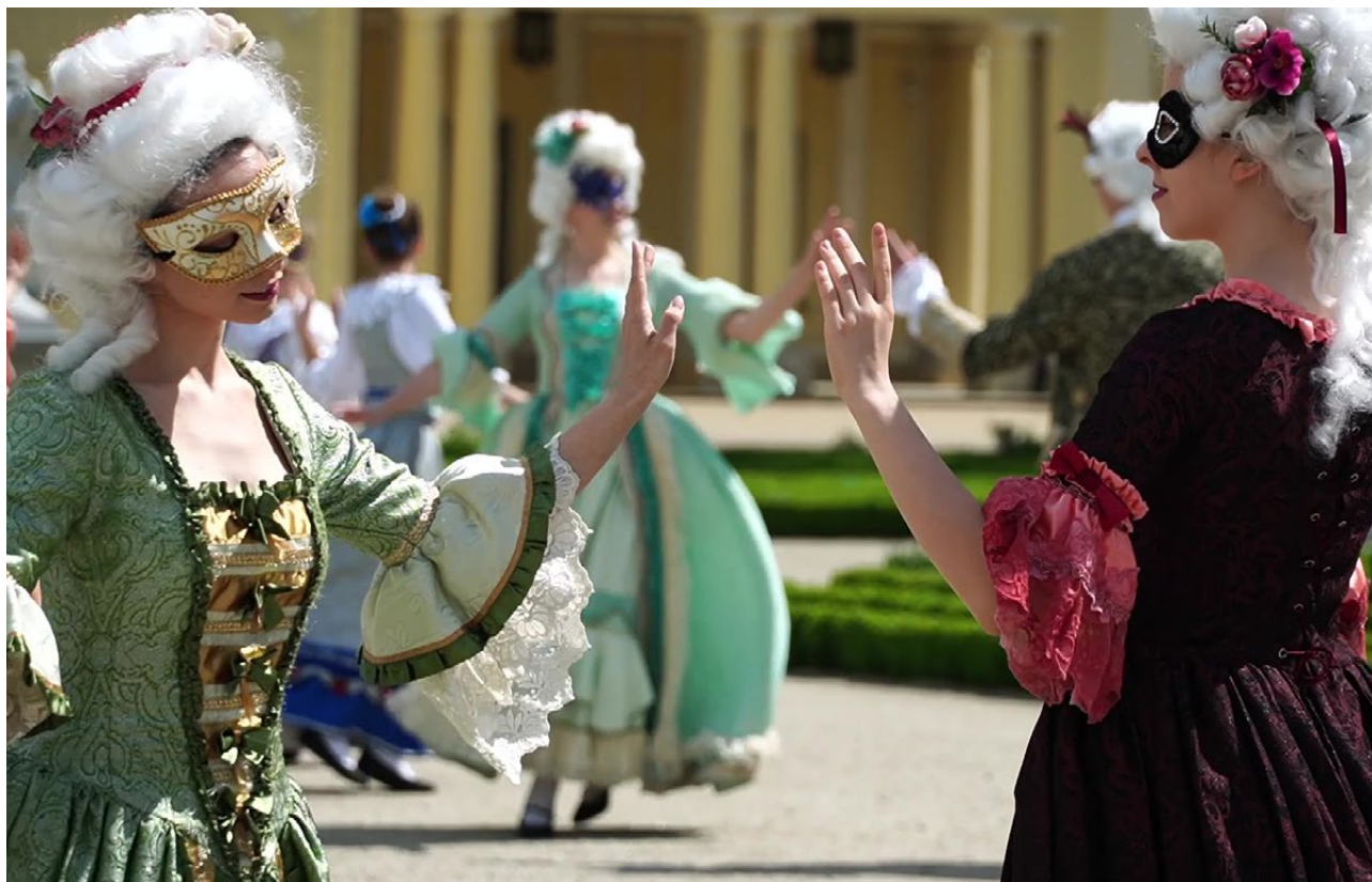
Festiwal Barokowe Ogrody Sztuki, Białystok 2020