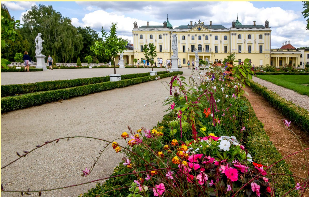
Lato w Ogrodzie Branickich w Białymstoku