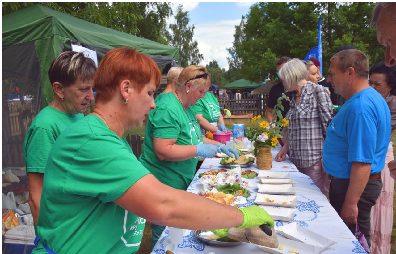
Smaki Podlasia w Podlaskim Muzeum Kultury Ludowej, 2019