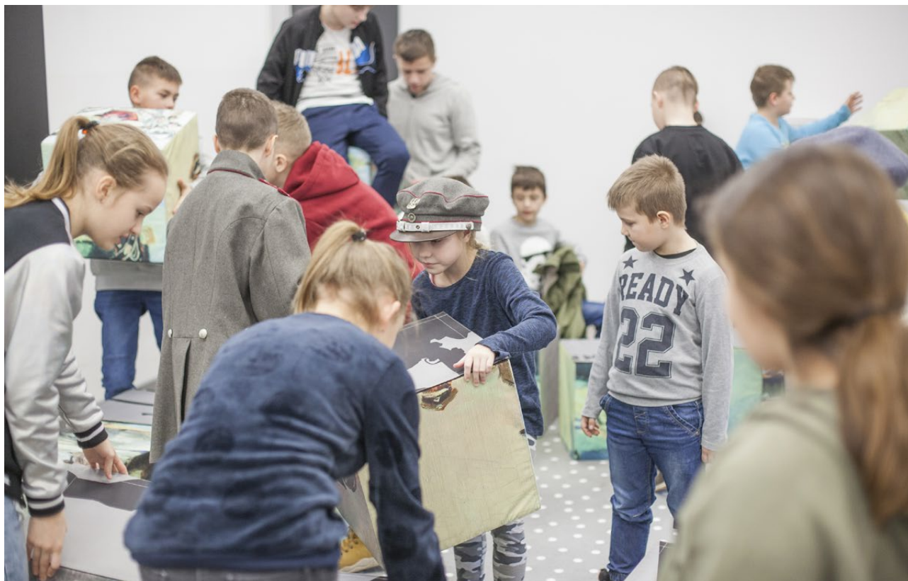
Ferie zimowe w Muzeum Wojska w Białymstoku, 2020