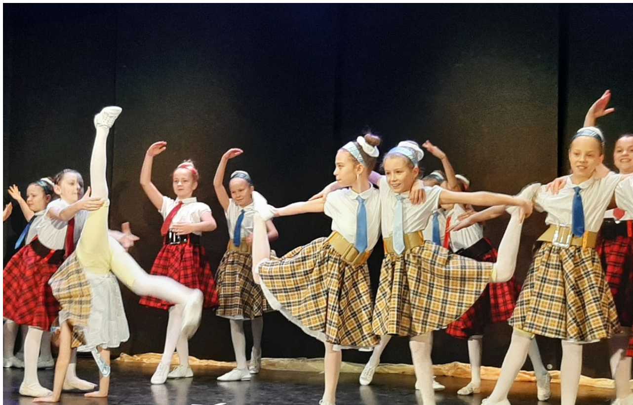
Prezentacje Domu Kultury „Śródmieście” w Białymstoku