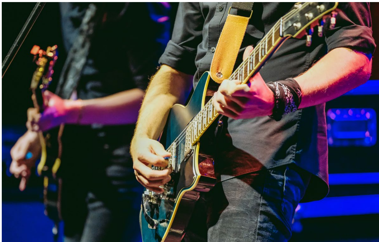
Wojewódzki Przegląd Zespołów Rockowych Rockowania , Podlaski Instytut Kultury, 2020