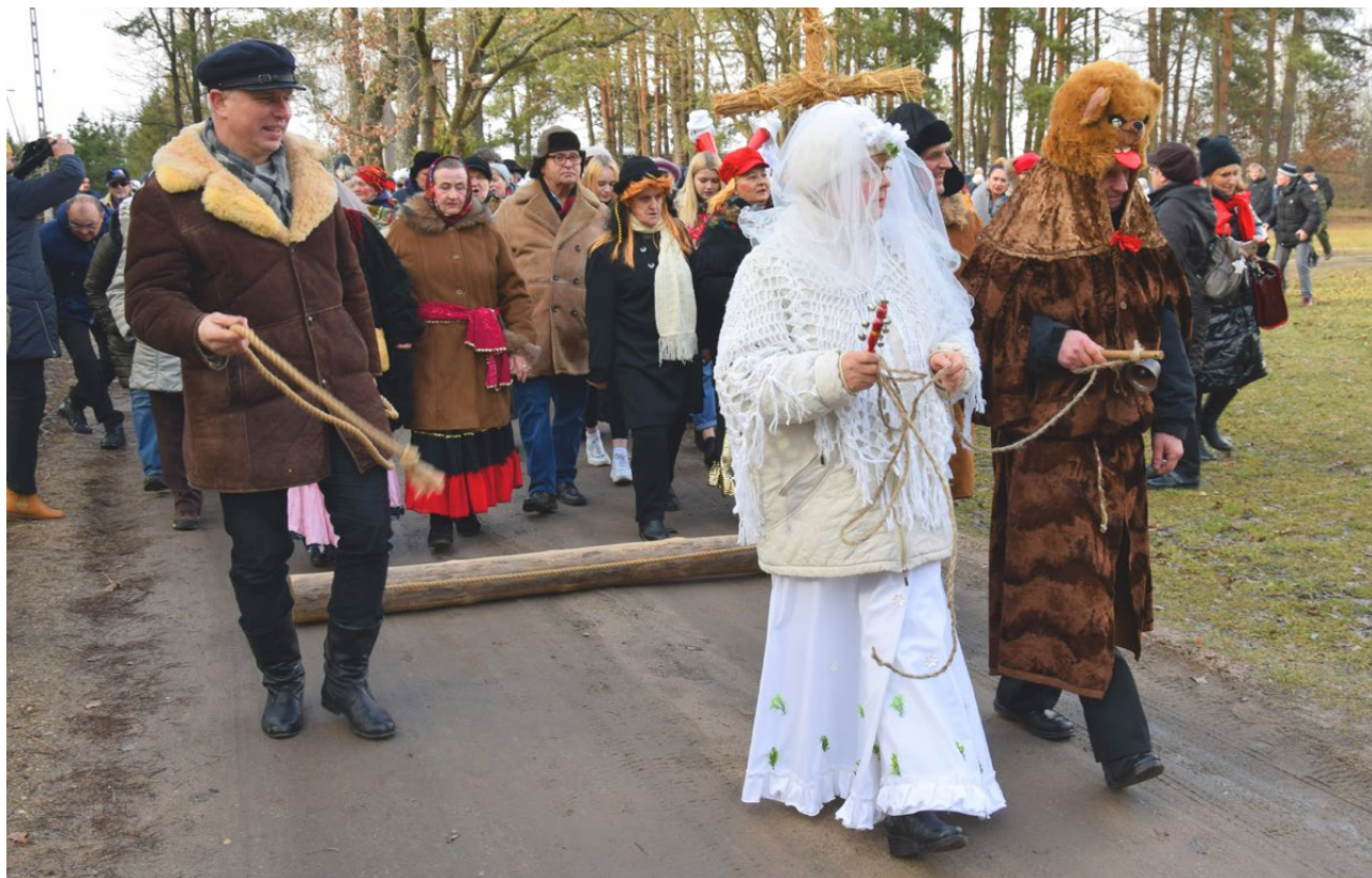
Zapusty w Skansenie, Podlaskie Muzeum Kultury Ludowej, 2020