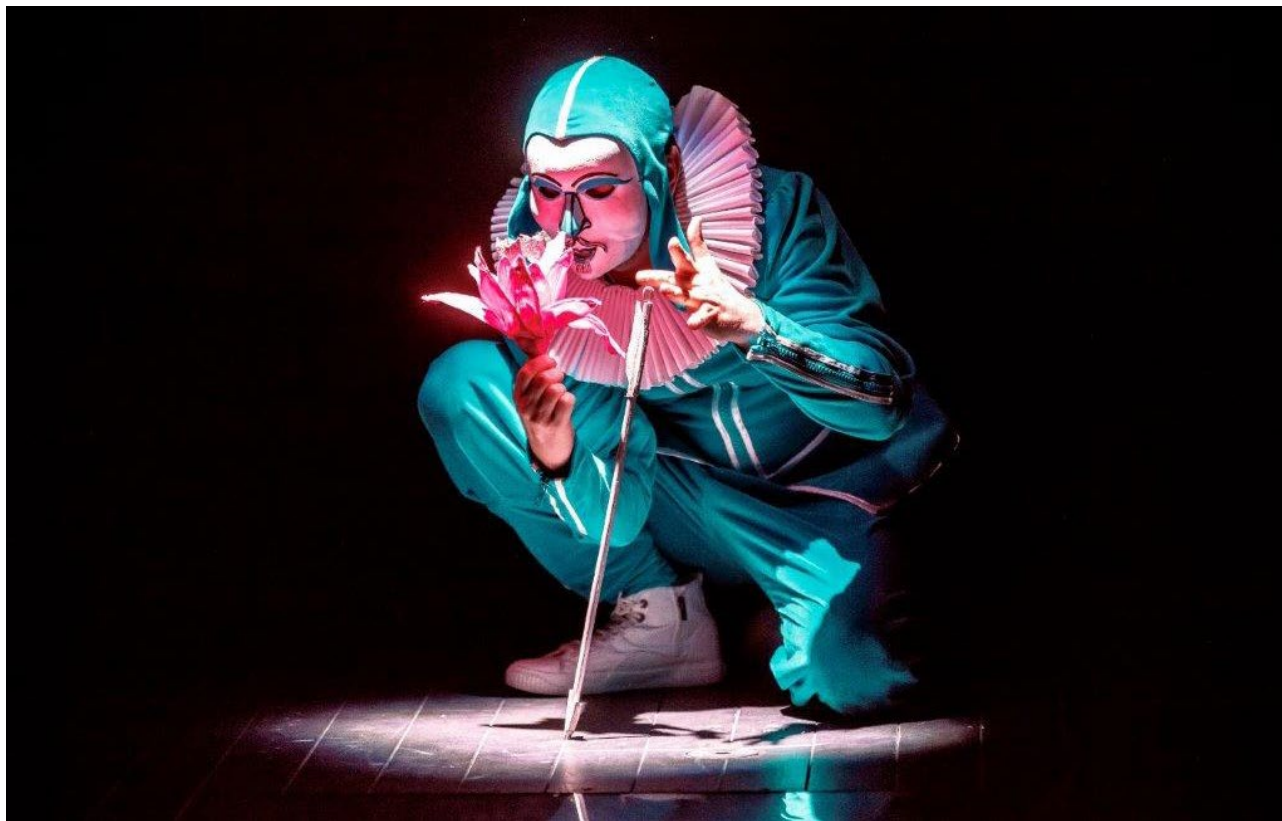
Spektakl Sen nocy miłości w Białostockim Teatrze Lalek, 2020