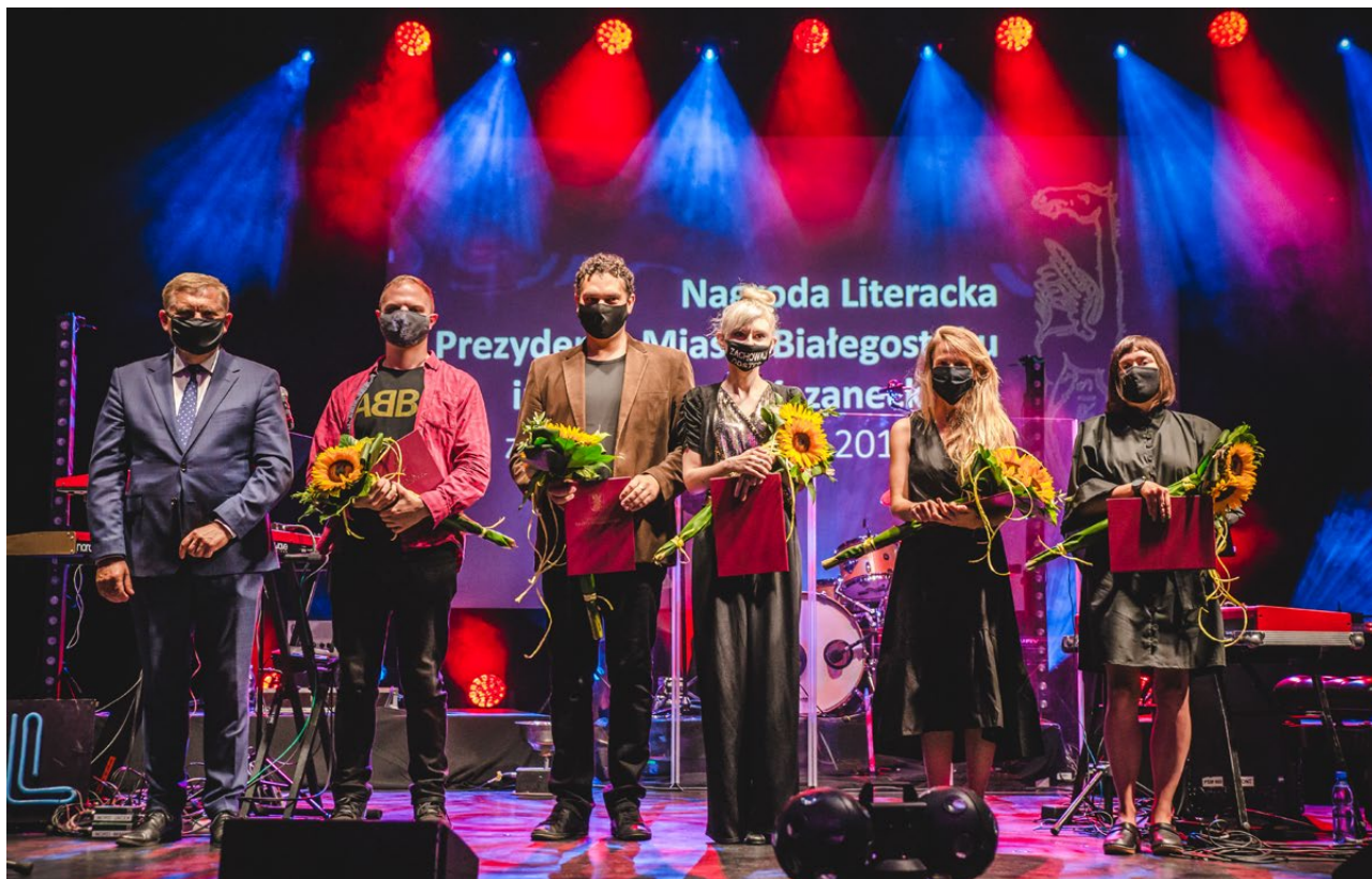
Wręczenie Nagrody Literackiej Prezydenta Miasta Białegostoku im. Wiesława Kazaneckiego, kino Forum, 2020