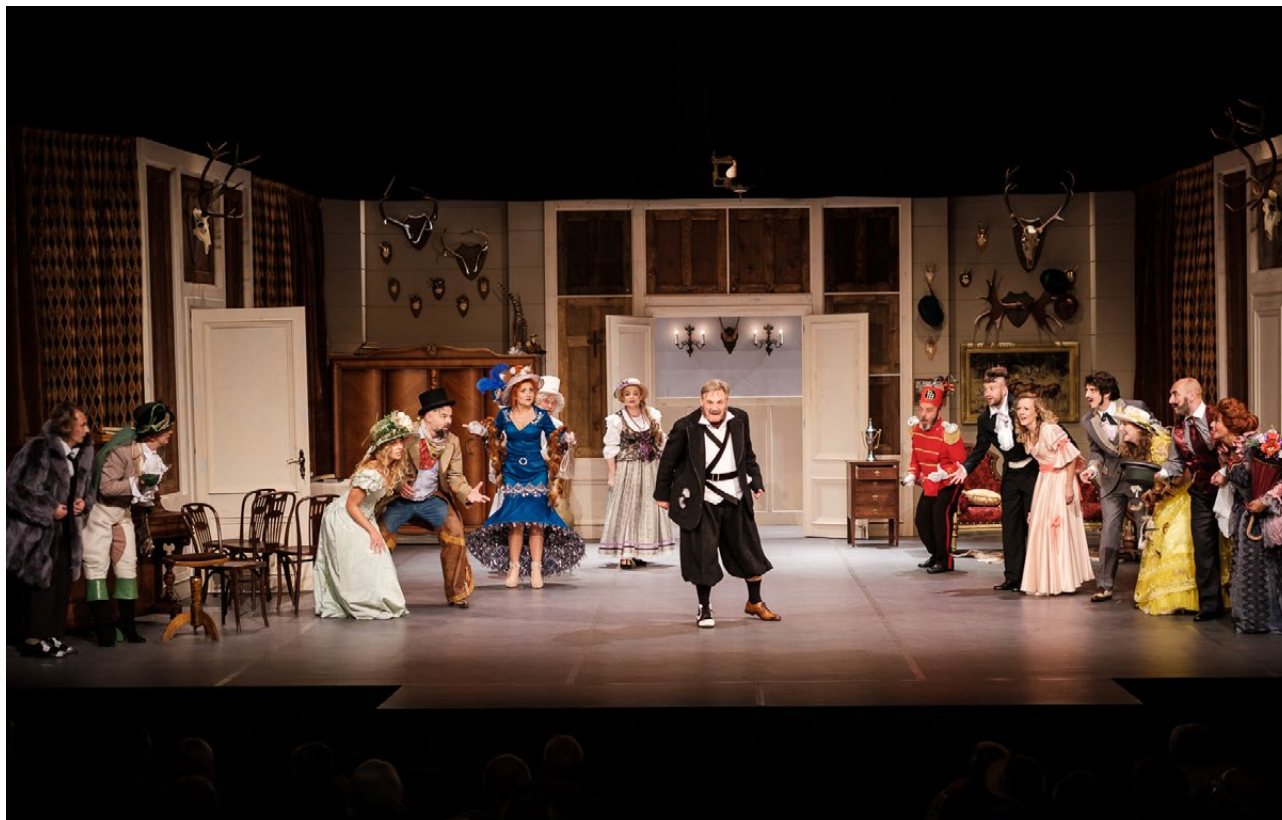
Spektakl Pensjonat Pana Bielańskiego w Teatrze Dramatycznym w Białymstoku, 2020