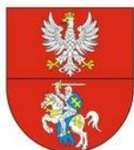
Marszałek Województwa Podlaskiego