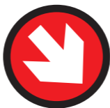
Oznaczenie lewej granicy narciarskiej trasy zjazdowej