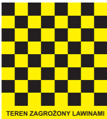
Wejście na teren zagrożony lawinami