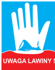
Bezpośrednie zagrożenie lawinami, dalsze przejście lub przejazd zagraża życiu i zdrowiu