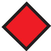
Oznaczenie przebiegu trasy biegowej