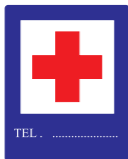
Punkt ratownictwa narciarskiego