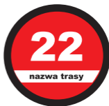
Oznaczenie przebiegu narciarskiej trasy zjazdowej lub narciarskiej trasy zjazdowej z numerem trasy i możliwością umieszczenia nazwy trasy,