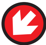
Oznaczenie prawej granicy narciarskiej trasy zjazdowej