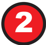
Oznaczenie przebiegu narciarskiej trasy zjazdowej lub narciarskiej trasy zjazdowej z numerem trasy,