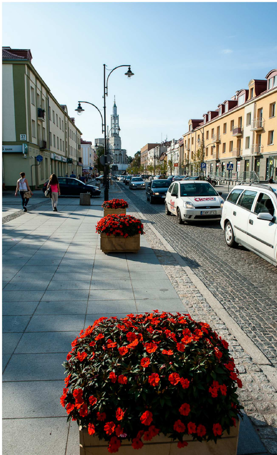
Przebudowa ulicy Lipowej na odcinku od ul. Malmeda do Placu Niepodległości wraz z wlotami ulic bocznych