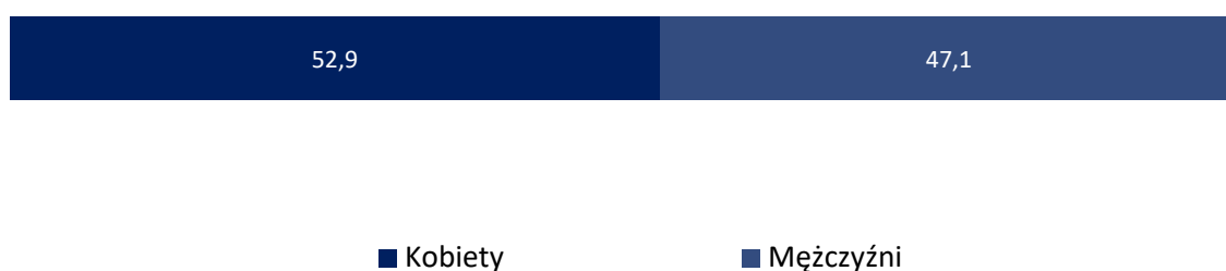
Wykres 1. Struktura płci [%]