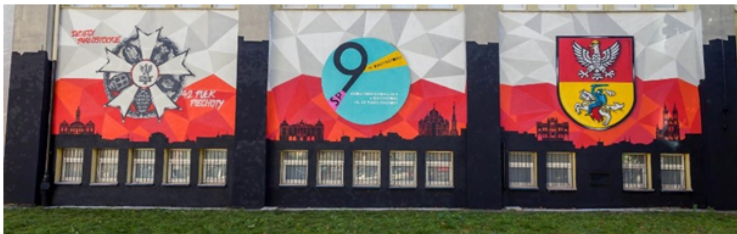
Szkoła Podstawowa nr 9 im. 42 Pułku Piechoty w Białymstoku

W tej sekcji będziemy przedstawiać najciekawsze murale zdobiące białostockie szkoły.