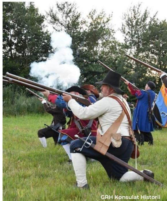
GRH Konsulat Historii