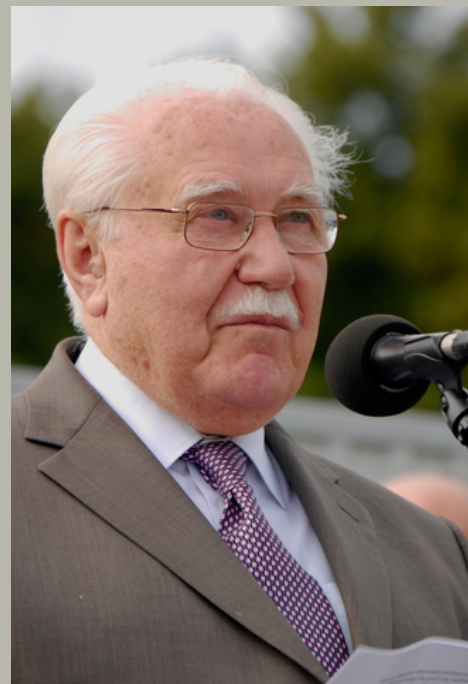
Były prezydent Rzeczypospolitej na uchodźstwie Ryszard Kaczorowski...

– prezydent Kaczorowski w przemówieniu podczas uroczystości nadania honorowego obywatelstwa Miasta Białegostoku