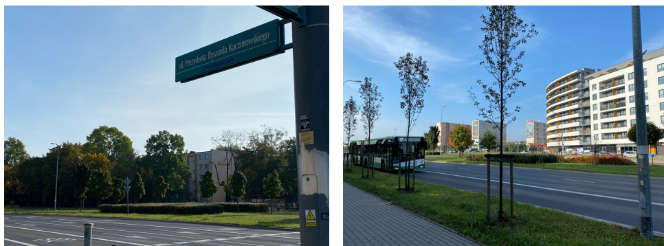
Ulica Prezydenta Ryszarda Kaczorowskiego w Białymstoku