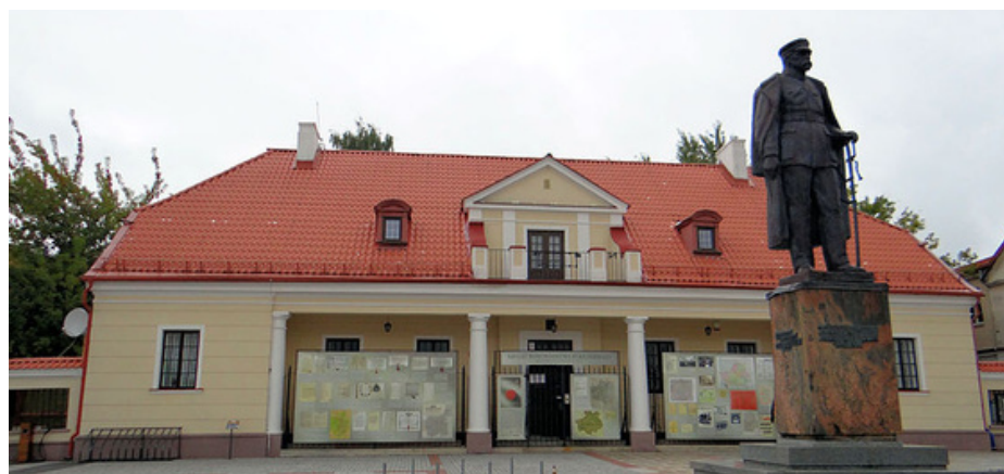
Pomnik Józefa Piłsudskiego w Białymstoku

https://www.rodm-bialystok.pl/index.php/nasze-dzialania/publikacje/378-publikacja-wizyty-jozefa-pilsudskiego-w-bialymstoku