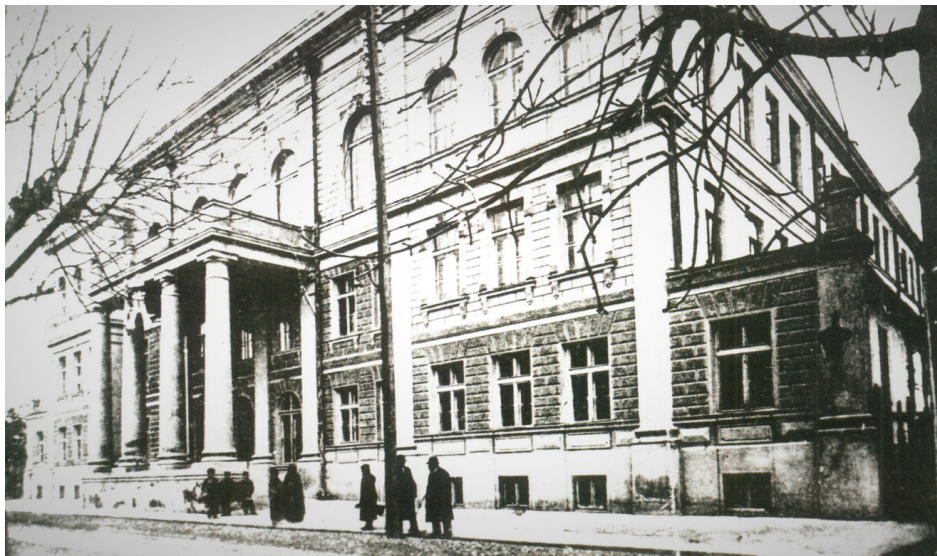
Gmach rosyjskiej szkoły handlowej (do 1915 r.) przy dzisiejszej ul. Warszawskiej 63. Od listopada 1915 r. siedziba Polskiego Gimnazjum Realnego (męskie i żeńskie) na drugim piętrze.

„Na otwarcie gimnazjum wybrano 29 listopada 1915 r. W ten sposób planowano uczcić pamięć młodych powstańców listopadowych z 1830 r. Oprócz uczniów – dziewcząt i chłopców – w tym szczególnym wydarzeniu w Białymstoku uczestniczyli przedstawiciele społeczeństwa, rodziców, członkowie Rady Pedagogicznej oraz reprezentanci władz okupacyjnych”.