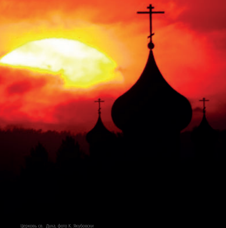
Церковь св. Духа