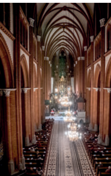
Интерьер Архикафедрального Собора Успения Пресвятой Девы Марии

Во второй половине XIX века, когда Белосток вырос до размера многотысячного промышленного города, местная католическая община отчаянно нуждалась в новом храме. Небольшой, построенный в XVII веке храм был не в состоянии вместить даже малой толики верующих. Однако согласие на строительство нового костёла нужно было получить от царских властей, а те неоднократно отказывали. В этой ситуации белосточане применили продуманную и, как выяснилось, очень эффективную уловку: обратились с ходатайством разрешить расширение существующего костёла. Таким образом было построено огромное неоготическое здание, которое по документам являлось лишь пристройкой к существующему храму, не исключено, что самой большой пристройкой в мире!