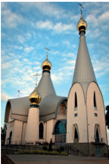
Церковь св. Георгия, фото И. Чайковска

Двухуровневый храм, впечатляет своей современной формой, был спроектирован профессором Ежи Усциновичем. Краеугольный камень был заложен в 2000 году, строительство длилось более 10 лет. Над характерной изогнутой крышей церкви возвышаются пять луковичных позолоченных куполов. За декор верхней православной церкви – фрески, проект иконостаса и заполняющие его иконы – отвечал Ярослав Вищенко.