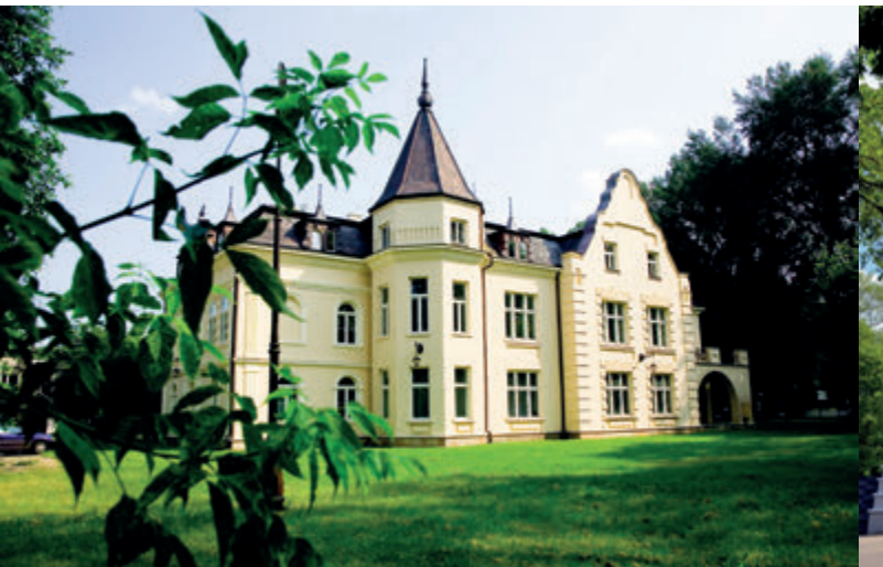
Дворец Хасбаха

экспозициям Исторического музея (стр. 88) посетители могут любоваться не только отреставрированными фресками в стиле сецессии, но также полностью реконструированным видом богатой белостокской резиденции рубежа XIX и XX веков.