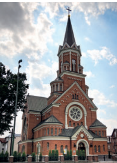
Костёл св. Войцеха