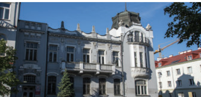
Дворец Новика

До наших дней сохранились не только достопримечательности, но и истории о драматических судьбах состояний промышленников, о создании текстильных империй, а иногда и о их стремительном упадке. Стоит заглянуть в старинные дворцы и познакомиться с увлекательной историей их жителей.