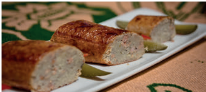
Картофельная кишка