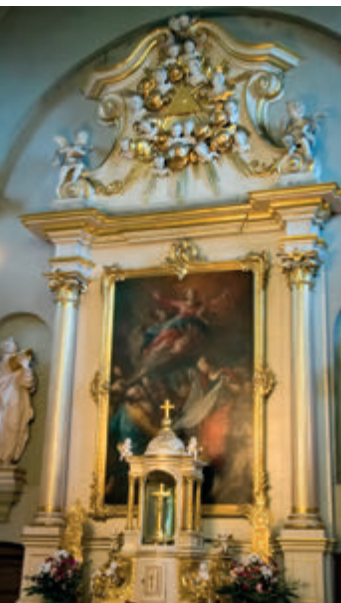
Главный алтарь в старом фарном костёле

святой Девы Марии Сильвестра Августина Мириса в главном алтаре, киворий (алтарная сень над престолом (алтарём), поддерживаемая колоннами – пер.) со Святым сакраментом, позолоченный антипендий (атрибут алтаря – пер.) на фронтальной стене стола жертвоприношений в главном алтаре, два боковых алтаря – Пресвятой девы Марии и Распятия Господня – амвон, купель и органы. Возле боковых алтарей находятся два мраморных XVIII-вечных монумента. Первый, слева от главного алтаря, из цветного мрамора, с сердцем Яна Клеменса Браницкого, был подарен женой гетмана Изабеллой Браницкой. Второй, из черного мрамора, содержит сердца Стефана Миколая Браницкого и Катажины Александры Браницкой из рода Чарнецких (отца и бабушки Яна Клеменса Браницкого).