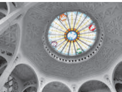
Витражный плафон в костёле Христа Царя и св. Роха

смотря на постоянное отсутствие средств. Краеугольный камень под строительство храма был заложен в 1927 году. Работы продолжались 20 лет, даже во время Второй мировой