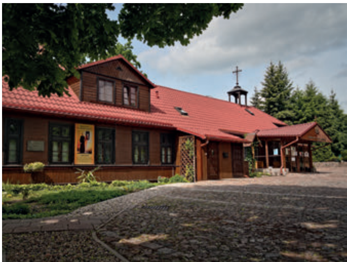
Часовня Сестер Милосердного Иисуса

в часовне, с которой был связан с 1955 г. года, развивая культ Божьего Милосердия. Умер в доме сестер-миссионерок 15 февраля 1975 года.