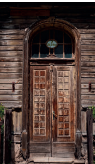
Дом в Боярах

Район Бояры – одно из самых магических мест в Белостоке. Несмотря на то, что находится в самом центре города, район сохранил все очарование пригорода, где жизнь течёт своим