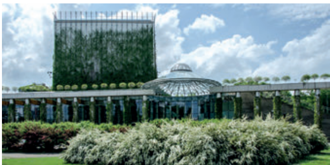
Подляшская опера и филармония

Концепция здания, построенного в 2006-2012 гг., возникла в мастерской проф. Марка Будзиньского, известной также созданием проектов зданий Верховного суда и Университетской библиотеки в Варшаве. Как и другие проекты этого архитектора, Белостокская опера идеально вписалась в окружающую среду. Широким стеклянным холлом здание открывается на зелень Центрального парка, одновременно вьющаяся растительность мягко окутывает его колонны, крышу и стены. Здание построено в минималистском стиле – из необработанного бетона и стекла. В нём располагается современный концертный зал со зрительным залом на почти 800 человек и камерный зал. В огромном фойе впечатление необъятности пространства усиливают стеклянные лестницы и лестничные площадки. Интерьеры украшены композициями Томаша Урбановича с записью произведений С. Монюшки, Ю. Максимюка и К. Пендерецкого. Возможно посещение сада, расположенного на крыше оперы.