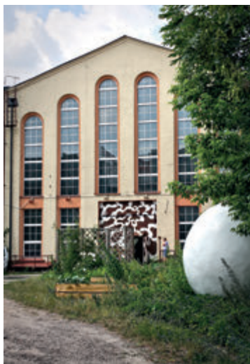
Здание бывшей электростанции

Здание старейшей белостокской электростанции было построено в 1908-1909 годы. Является прекрасным примером промышленной архитектуры эпохи раннего модернизма и первым в Белостоке зданием, в котором применена железобетонная конструкция. Объект несколько раз перестраивали, а после Второй мировой войны он был восстановлен согласно плану 30-х годов XX века. Внимание привлекают фронтальные фасады отдельных павильонов электростанции с треугольными завершениями и высокими узкими окнами, а также тянущийся вдоль реки Белой боковой фасад с огромными полукруглыми окнами. В 2010 году один из павильонов электростанции был передан в распоряжение Галереи Арсенал (стр. 87).