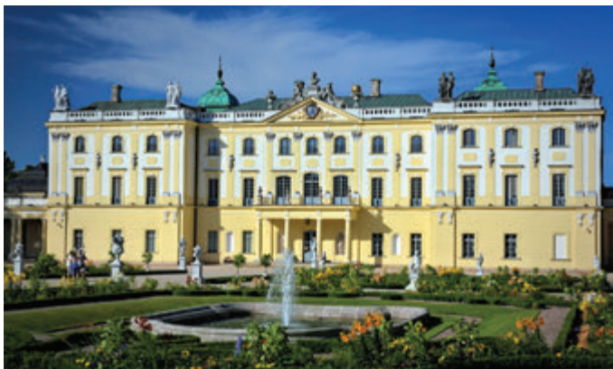
Дворец Браницких, вид со стороны садово-паркового комплекса

(ректорат университета), интерьер только частично воссоздан в соответствии с его XVIII-вечным обликом. Стоит обратить внимание на сохранившиеся исторические элементы интерьера времен Браницких: скульптуры атлантов на лестничной клетке, мраморную фигуру Ротатора при входе на лестницу, колонны из черного мрамора в холле, две плиты каминов с гербами («Гриф» Браницких и «Телок» Понятовских) в читальном зале, фрагменты древней лепнины в дворцовой часовне и в двух кабинетах бывших Золотых апартаментов (нынешнем кабинете ректора Медицинского университета), а также сохранившийся живописный декор на стенах. Во время экскурсии с экскурсоводом из Музея истории медицины и фармации, существует возможность посещения Aula Magna, часовни и дворцовых подвалов. О старинной усадьбе Весёловских напоминают: стрельчатое подвальное окошко, открытое в садовом фасаде, цилиндрические своды подвалов, открытые фрагменты фундаментов, кирпичный пол в одном из подвальных помещений.