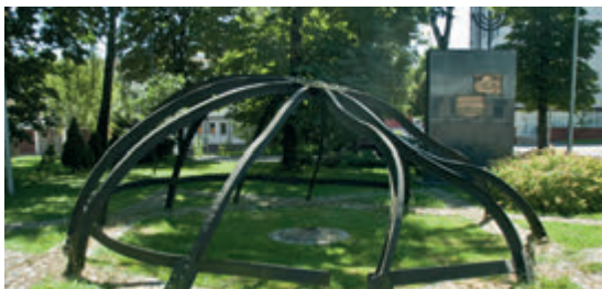
Мемориал Большой Синагоги