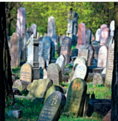
Кладбище на ул. Восточной

надгробий. В последние годы часть надгробий была восстановлена. В центральной части кладбища находится охель (часовня) раввина Хайма Герца Халперна, установленная в 1922 году. На кладбище похоронены жертвы погрома 1906 года и установлен памятник в виде гранитного обелиска. Кладбище могут посещать только организованные группы с экскурсоводом.