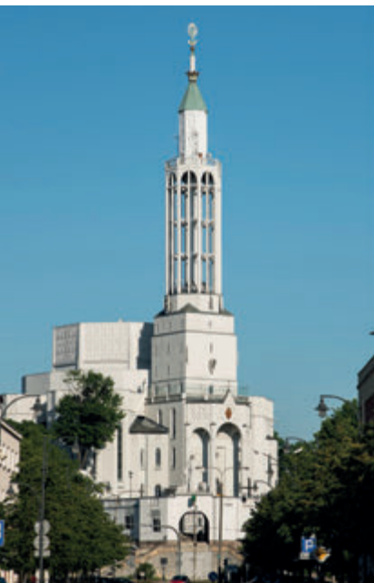
Базилика св. Роха, фото А. Грабовски

Белосток был захвачен немцами 15 сентября 1939 года, но уже через неделю был передан СССР в соответствии с пактом Риббентропа-Молотова. Город стал столицей провозглашенной оккупантами Республики Западная Беларусь. Население очень быстро испытало на себе российский террор. Наиболее трагическими в своих последствиях оказались депортации вглубь СССР, которым подверглось около 20 000 белосточан.