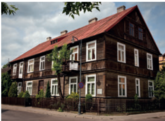
Дом на ул. Злотой 9

Двухэтажный дом с 1934 года, является прекрасным примером деревянного зодчества, характерного для довоенного Белостока. С 1947 года на протяжении более 20 лет о. Сопецько снимал здесь квартиру под номером 4.