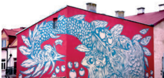
Мурал «Дракон-курица»