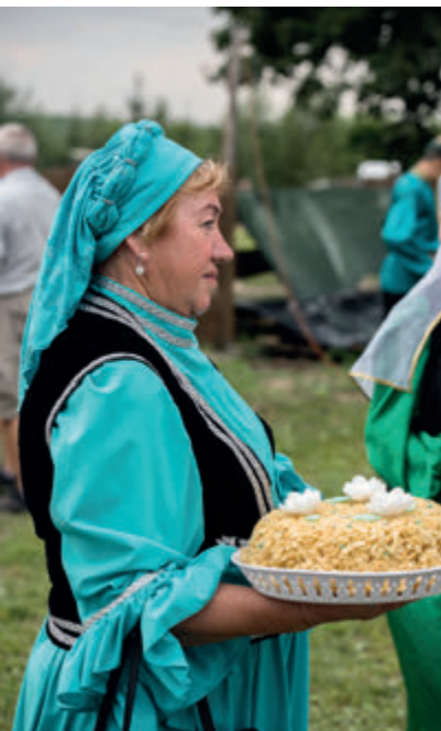
Татарские деликатесы

которые устанавливают свои бунчуки (древко с привязанным хвостом коня, служившее в XV—XVIII веках знаком власти – пер.) на пожалованных им землях.