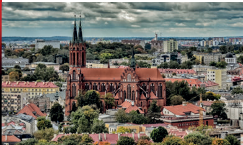
Архикафедральная базилика – Собор Успения Пресвятой Девы Марии