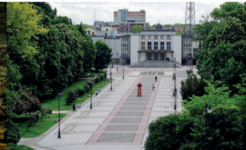
Старый парк с Театром им. А. Венгерки

Возник в конце XIX века на месте осушенного большого пруда и Марсовых полей, т. е. площади военных учений времен гетмана Браницкого. В центре парка находится построенный