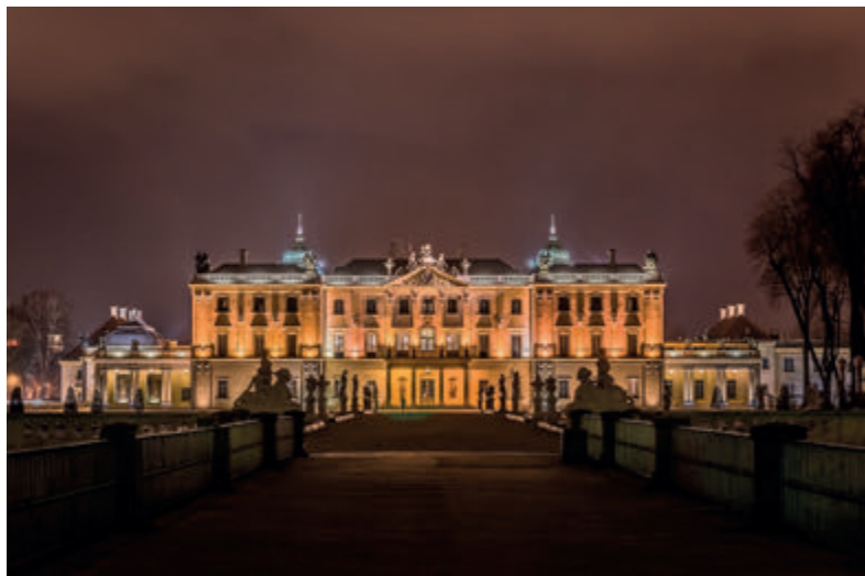
Дворец Браницких ночью

гетмана об обязанности оштукатуривания только парадных фасадных стен домов для повышения их презентабельности со стороны улицы). Благодаря фонду Браницких были построены многочисленные здания, которые, реконструированные после войны, до сих пор радуют глаз прохожих. Отреставрированные в цветах эпохи (светло-желтый и белый), они представляют в городском пространстве выразительное наследие знаменитого рода XVIII-вечных владельцев.