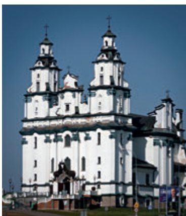
Костёл Воскресения Господня

Многие туристы, въезжающие в Белосток со стороны Варшавы, обращают внимание на расположенный на небольшом холме бело-зеленый «барокковый» костёл. Удивительно, но храм был создан в 1991-1996 годах по проекту Михала Балаша. Прообразом для него стал XVIII-вечный костёл св. Петра и Павла в Березвече – выдающийся пример вильнюсского ба-