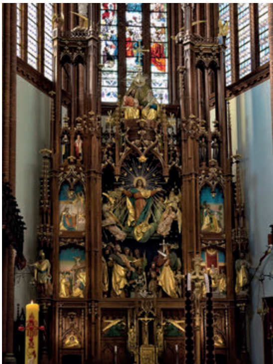
Главный алтарь в Архикафедральном Соборе Успения Пресвятой Девы Марии

чатых портала входной двери с барельефами в тимпанах, изображающими Христа, несущего крест, распятие и воскресение. Храм был основан на плане латинского креста. Между главным нефом и двумя боковыми тянутся ряды мощных колонн, поддерживающих крестово-ребристые своды. Большие стрельчатые окна и розетка над входом заполнены витражами.