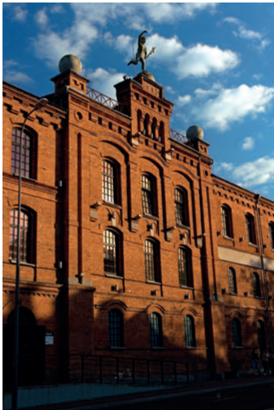
Старинный склад готовых изделий бывшей фабрики Беккера

Одним из самых больших промышленных предприятий Белостока была Фабрика шелковых плюшей Общества Белостокской мануфактуры «Э. Беккер и компания», расположенная на пересечении улиц Мицкевича и Свентоянской. Работало в ней несколько сотен человек и она функционировала непрерывно до Второй мировой войны. Большин-