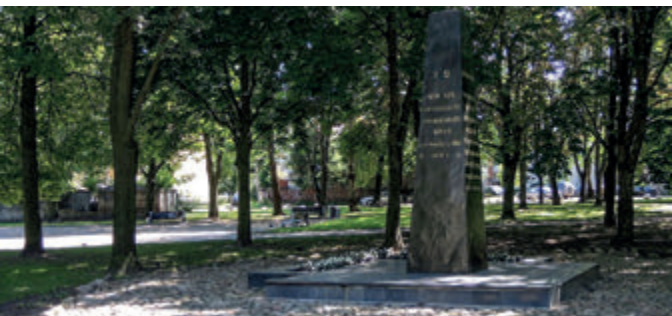
Памятник Героям гетто, фото А. Грабовски7

Большинство из них принадлежало к бедным слоям населения, но были и состоятельные купцы, предприниматели – владельцы текстильных заводов. Были и такие, которые сделали сказочное состояние, как Исаак Заблудовский – купец, первый еврейский миллионер в России.