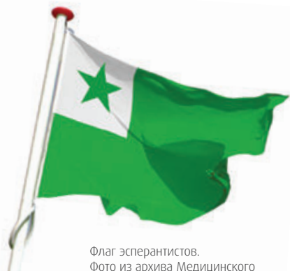
Флаг эсперантистов.

детских лет, которое определило все моим будущие начинания. Жители Белостока состояли из [...] русских, поляков, немцев и евреев. [...] В таком месте, как в никаком другом, чувствительная натура ощущает бремя разноязычия и делает вывод, что разность языков – одна из главных причин разделения человеческой семьи на враждующие лагеря.