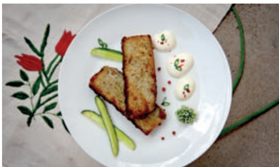
Картофельная баба

Из литовской кухни позаимствованы картачи , также именуемые цеппелинами . Их продолговатая, овальная форма действительно напоминает дирижабли, летающие более 100 лет назад над Белостоком (цеппелины -тип жёстких дирижаблей немецкой фирмы – пер.) Картачи – это тесто из