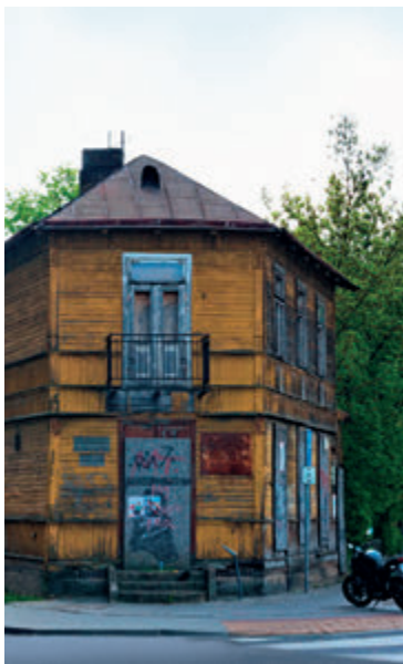
Дом на ул. Мазовецкой 31

Дом входит в состав, так называемого, квартала Ришарда Качоровского, т. е. группы зданий, которые помнят времена, когда последний президент РечиПосполитой в изгнании жил на улице Мазовецкой 7. Школа, в которой он учился, располагалась под номером 35 в существующем и поныне каменном доме с 1863 года. В настоящее время на его фасаде установлена мемориальная доска. Представление о том, как выглядел несуществующий ныне дом будущего президента, мы мо-