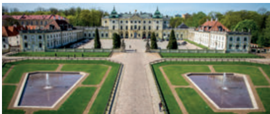
Передний двор и парадный двор

овальный щит с золотой монограммой JB, расположенной на голубом поле. Ниже циферблатов часов находится паноплия (в искусстве ренессанса и барокко декоративная композиция из элементов античных военных доспехов, щитов, оружия и знамён – пер.) с Юпитером в образе взлетающего орла, а на внешнем фасаде – слепые окна, покрытые иллюзионистскими росписями, точно имитирующими реальные окна.