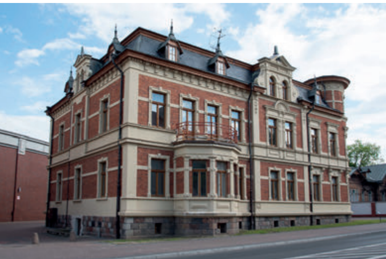
Дворец Правления бывшей фабрики Беккера

ство заводских зданий уничтожили отступающие немцы, но вскоре вновь было запущено текстильное производство под вывеской фабрики «Бируна». В XXI веке объект был полностью перестроен для нужд торгового центра, сохранилось, однако, много элементов первоначальной индустриальной застройки. Уцелел огромный трехэтажный склад готовой продукции, внесенный в реестр памятников архитектуры и культуры, построенный на улице Свентоянской в 1895 году. Строгий фасад из красного кирпича, с находящимся по центру неглубоким ризалитом, был украшен статуей бегущего Меркурия, римского бога торговли – отсюда и бытующее среди местных название здания. В настоящее время фасад Меркурия – визуальный символ промышленного Белостока – является частью фасада торгового центра. В современный фасад органично вписалась также торцовая стена самого старого здания фабрики – отделочного цеха, а ее прежняя кубатура нашла своё отражение в форме торгового пассажа. В пространство торгового центра было также включено здание бывшей конюшни и кареточной 1911 года, в которых в настоящее время располагаются подсобные помещения ресторана. Торговый центр «Альфа» является одним из самых интересных примеров того, как можно сохранить постиндустриальное наследие путём адаптации промышленных зданий под современные требования.