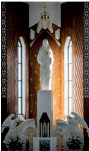
Главный алтарь в костёле св. Роха