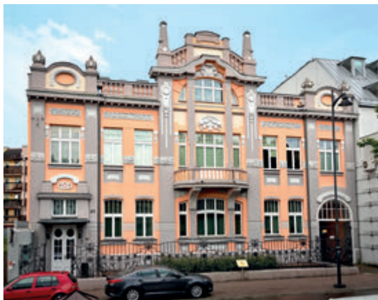
Дворец Цитронов

В интерьерах сохранилась первоначальная планировка помещений и величественная мраморная лестница. Благодаря