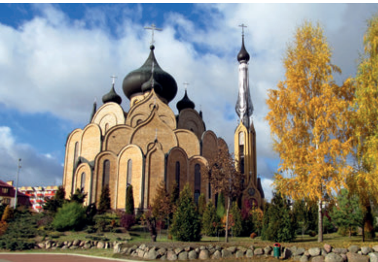
Церковь св. Духа

Архитектура храма пропитана глубокой символикой. Стены и купола имеют форму языков пламени. Вся архитектурная концепция церкви основана на символике Сошествия Святого Духа. Пять куполов в традициях восточной архитектуры символизируют Христа с четырьмя апостолами-евангелистами.