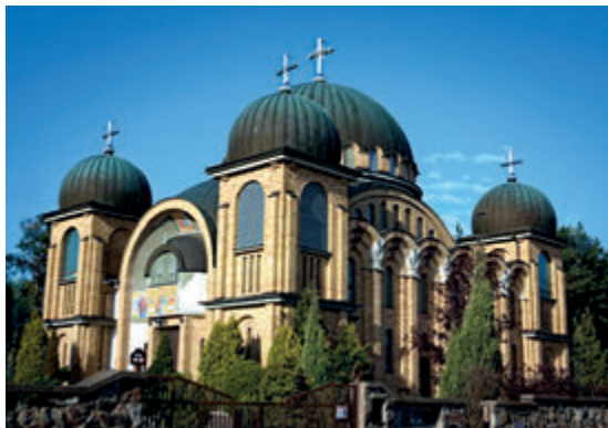
Церковь Премудрости Божией, фото А. Тарасевич

Интерьер храма представлен фресками, концепцию которых разработал выдающийся профессор из Салоников Константинос Ксенопулос, а создали четверо греческих ху-