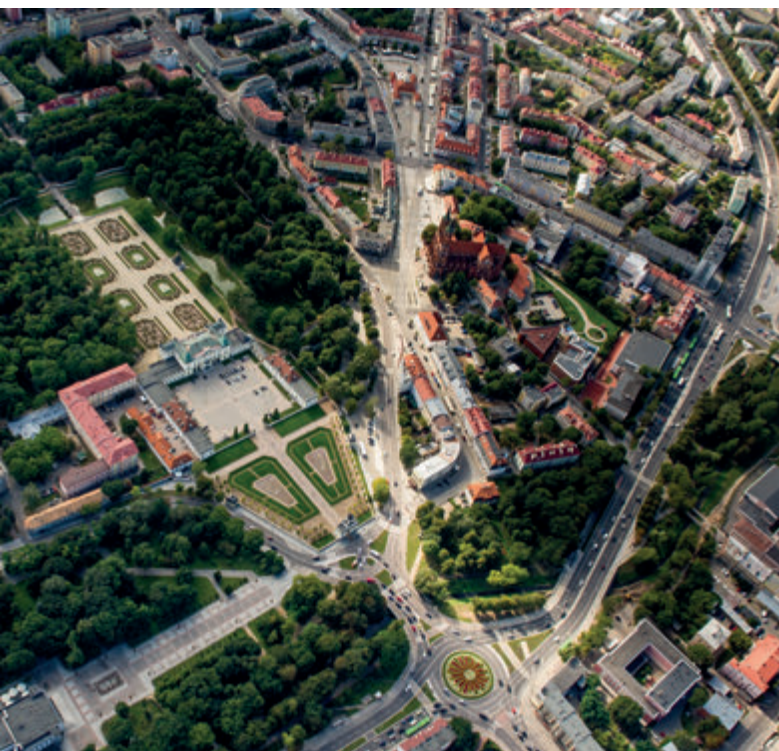
Исторический центр города

Рассматривая большой макет бароккового Белостока, находящийся в Историческом музее (стр. 88), мы увидим, как на ладони, что город XVIII века - это, прежде всего, садово-дворцовый комплекс Браницких. Он состоял из главного здания дворца, различных бытовых помещений и построек (оранжереи, арсенал и т.д.), садов с павильонами и зверинцев с прудами и водными композициями. Сам город, с рынком и костёлом, представлял собой, в некотором смысле, функциональный придаток к польскому Версалью. Однако, заботясь о своей резиденции, Ян Клеменс и Изабелла Браницкие, одновременно инвестировали и в развитие города. Из сохранившихся документов следует, что Браницкие лично решали множество социальных и экономических вопросов, касающихся Белостока. Они заботились о его облике, хотя иногда только внешнем (известен, в частности, указ