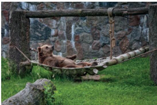
Белостокский зоосад