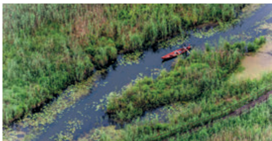
Нарвянский национальный парк, фото К. Якубовски

В нескольких километрах от Белостока находится дикая долина реки Нарев, где река несёт свои воды несколькими руслами, образующими настоящий лабиринт. Вокруг на десятки гектаров простираются болота – места обитания более 200 видов птиц, в том числе более десяти очень редких охраняемых видов. Территория парка отнесена к водно-болотным угодьям, имеющим международное значение как места обитания водоплавающих птиц. Нарвянский национальный парк является идеальным местом для байдарочников. Туристы-пешеходы могут воспользоваться маршрутами, проложенными по деревянным мостикам: в Курове – возле здания