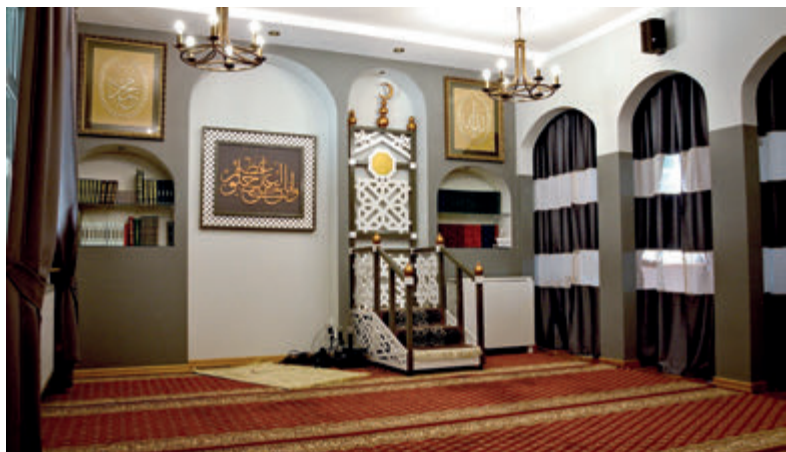
Интерьер молитвенного дома

Белосток является одним из пунктов туристического маршрута «Татарский путь», описание которого вы найдете в разделе Окрестности Белостока (стр. 106).