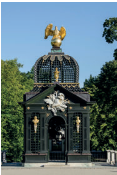
Павильон под Орлом

На границе садового салона и нижнего сада интерес вызывает реконструированный Павильон под Орлом. В этом строении, как и во всём садово-парковом комплексе, присутствуют элементы древнегреческой мифологии, связанные с Геркулесом. Вот мы имеем дело с моментом, когда, к лежащему на смертном одре Геркулесу прилетает Юпитер, в облике золотого орла, принося ему в клюве золотое яблоко и даруя бессмертие. Геркулес поселяется в обители богов, где его женой становится богиня юности Геба (бюсты обоих супругов обрамляют вход в павильон). Над всем доминирует декорация, символизирующая мужество и отвагу мифологического героя (бело-золотая композиция из различных видов оружия и военных аксессуаров, размещенная на шкуре льва), с которым Браницкий хотел, чтобы его сравнивали.