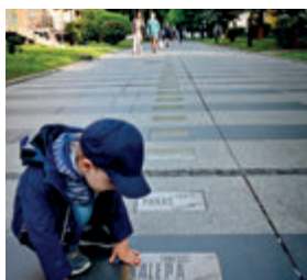
Аллея Блюза