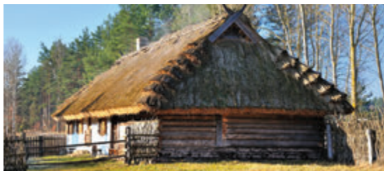
Подляшский музей народного творчества и культуры

Музей под открытым небом расположен на трассе, ведущей в сторону Августова. Здесь представлены примеры традиционной деревянной архитектуры с территории Подляшья. В интерьерах можно увидеть экспозиции, касающиеся многих аспектов повседневной жизни и выставки народного искусства. Эмоции посетителей вызывает оригинальный самогонный аппарат из Кнышинской пуши. Еще один интересный объект – Центр экологического образования Музея – Сокольник, поддерживающий польские традиции соколиной охоты. В музее под открытым небом проходит множество мероприятий, посвященных народной культуре региона, например, «Вкусы Подляшья», фестиваль татарской культуры и «Подляшье, душистыми травами пахнущее».