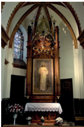
Часовня Иисуса Милосердного в Архиепархиальном Соборе Успения Пресвятой Девы Марии

дом находится часовня Богоматери Милосердия с культовой копией остробрамской иконы. Это место прекрасно иллюстрирует тесные связи Белостока с Вильнюсом. На протяжении сотен лет наш город входил в состав Вильнюсского архиепископства, о чем напоминает памятник, созданный по проекту Димитра Гроздева у восточной стены храма. После Второй мировой войны здесь была резиденция вильнюсского архиепископа.