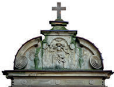
Тимпан портала старого приходского костёла