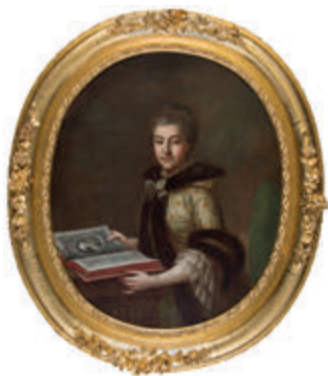
Изабелла Браницкая из Понятовских, из коллекции Подляшского музея в Белостоке

После смерти гетмана в 1771 году город и дворец перешли во владение его супруги. Изабелла из рода Понятовских управляла владениями до 1808 года. В историю города она вошла как заботливая хозяйка, основательница школы КЕН и новаторского Института акушерства. Была свидетелем событий, приведших к упадку Речи Посполитой и переходу Белостокских земель в состав Пруссии в результате III раздела Речи Посполитой.