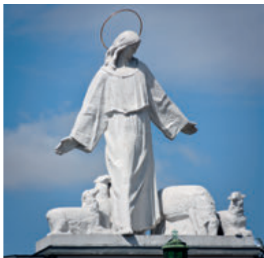
Христос Добрый Пастырь

На валах, окружающих храм со стороны города, внимание привлекает скульптура Христа Доброго Пастыря, авторства Станислава Хорно-Поплавского, одного из самых выдающихся польских скульпторов XX века. Еще одно его произведение – Богородица с Младенцем – находится на могиле о. Абрамовича при южном фасаде. Деревянный интерьер костёла органично вписыва-