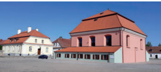
Большая синагога и Талмудистский дом в Тыкотине

ные дома, альюмнат с XVII века и старинный госпиталь. Площадь подковой «обнимают» плечи-фасады костёла Святой Троицы (барокко). Вся композиция была создана на пожертвования и по плану Яна Клеменса Браницкого. На противоположном берегу реки возвышается замок, продолжающий традицию мощной крепости короля Сигизмунда Августа. Посещая Тыкоцин, нельзя пройти мимо еврейского квартала с впечатляющей XVII-вечной позднеренессансной Большой Синагогой и музеем в бывшем Талмудистском Доме.