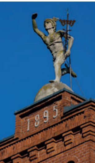
Скульптура Меркурия из фабрики Беккера, которая стала символом развития промышленности в Белостоке

Здесь он провел детские и юношеские годы, здесь же начал работу над производением своей жизни.