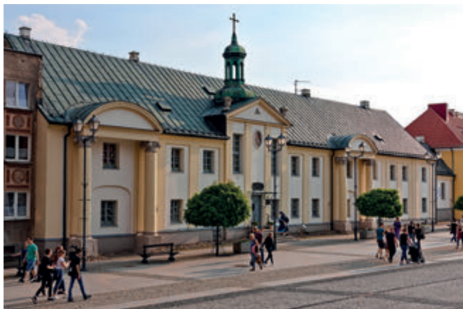
Монастырь Сестер Милосердия