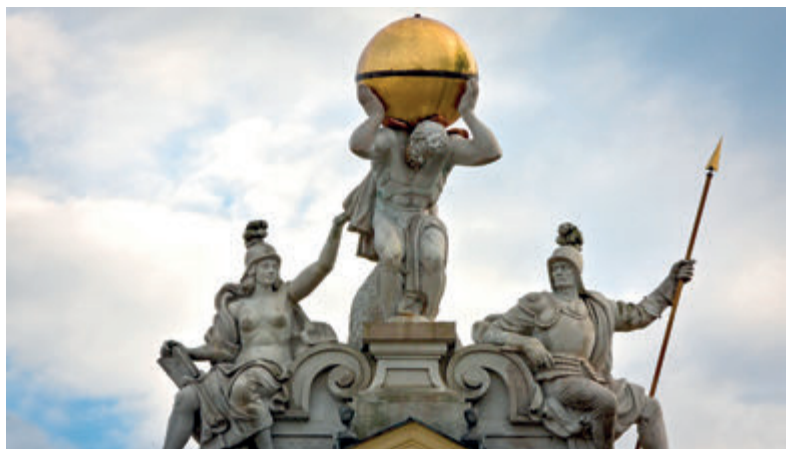
Так называемая группа Геркулеса над входом во дворец

Главный корпус дворца – трехэтажный с балконом в центральной части. Над главным входом в тимпане (внутреннее поле фронтона, углублённая часть стены над дверью или окном, обрамлённая аркой – пер.) установлен герб Браницких – Гриф, над ним возвышается скульптура Геркулеса в роли Атласа, несущего земной шар. Фасады дворца и флигелей украшены скульптурами, расположенными в нишах и на консолях. Многочисленные изображения Геркулеса и остальной скульптурный декор фасада создают иконографическую программу, апофеозирующую Яна Клеменса Браницкого как античного героя. Появляющиеся паноплии, представляющие элементы военного вооружения, должны были указывать на главную особенность Браницких Грифов – доблесть. Крыша дворца, с двумя барочными шлемами, окружена аттиком (декоративная стенка, возведённая над венчающим сооружением карнизом – пер.).