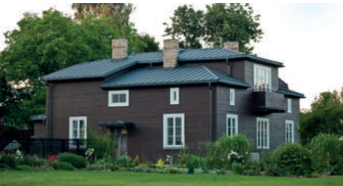
Вилла Вольтеров (модерн)

деталей. До недавнего времени напротив стоял дом, который «помнил» Юзефа Пилсудского. Товарищ «Виктор» часто приезжал в Белосток в бытность своей молодости, когда, действуя в конспирации, создавал структуры Польской социалистической партии.