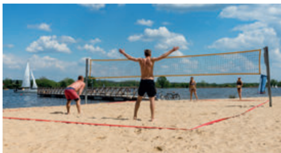
Залив в Дойлидах

Расположен в черте города, на берегу живописного водоёма. Центр водных видов спорта «Дойлиды» является любимым местом отдыха и рекреации белосточан. Летом притягивает жаждущих солнца на песчаный пляж, многочисленные детские площадки, тренажеры на открытом воздухе и площадки для пляжного футбола и волейбола. Здесь работает охраняемая купальня, водная детская игровая площадка и прокат плавучего снаряжения. Странники пеших, велосипедных и лыжных прогулок могут воспользоваться обширной сетью лыжных трасс и пунктов проката палок для скандинавской ходьбы, велосипедов, а зимой – беговых лыж. В объекте есть кемпинговое поле с инфраструктурой для автодомов, места для гриля и костра, порт парусного спорта и кладки для рыбалки.