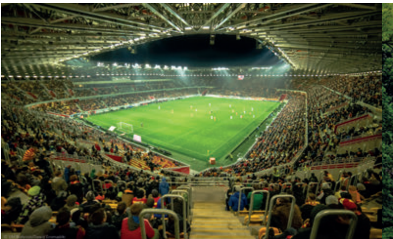
Городской стадион