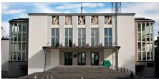
Драматический театр им. Александра Венгерки