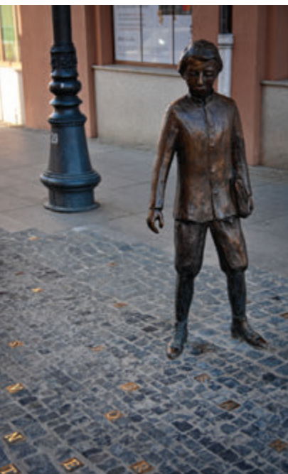
Памятник юному Людвигу Заменгофу

Бюст создателя эсперанто скульптора Яна Куча был установлен в 1973 году в сквере, недалеко от места рождения Заменгофа.