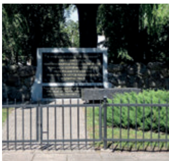
Памятник на кладбище гетто

В настоящее время на месте бывшего кладбища находится памятник, окруженный железным забором – здесь были собраны эксгумированные останки более 3500 человек. Рядом стоит памятный черный обелиск, на котором на трех языках – русском, иврите и идиш – выражена дань уважения героям борьбы в белостокском гетто. Торжества в их честь проводятся ежегодно, 16 августа, в годовщину начала восстания.