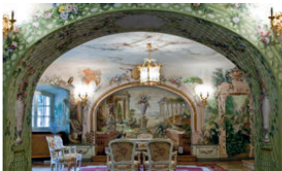
Интерьер Гостевого дворца