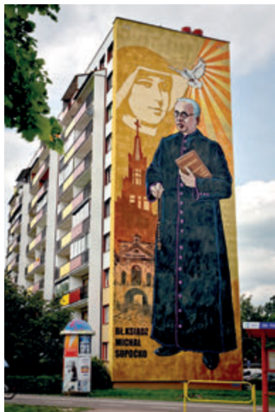
Мурал с изображениями блж. о. Сопецько и св. Фаустины