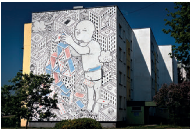
Instability

В рамках Дней современного искусства в 2015 году был создан мурал с мальчиком, который стоит среди небоскребов и трудолюбиво строит карточный домик. Его автором является знаменитый итальянский художник Франческо Камилло Джорджино (Francesco Camillo Giorgino), известный как Милло, характерные, выдержанные по цвету работы которого можно найти во многих городах мира и в ведущих галереях.