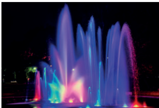
Фонтан на Плантах, фото. Администрация города Белостока

Парк, простирающийся вокруг дворца Браницких, находится на территории XVIII-вечного зверинца (вольерного хозяйства) ланей и оленей. Свой нынешний вид он получил в 30-е годы XX века. Со стороны улицы Мицкевича проходит впечатляющая Аллея влюбленных с фонтаном, который в субботние и воскресные вечера завораживает игрой света и форм, создаваемых брызгами воды. Рядом находится розарий и романтический пруд со скульптурой «Прачки», созданной выдающимся скульптором Станиславом Хорно-Поплавским. Параллельно ул. Академика тянутся бульвары им. Марьяна Зиндрама Костялковского, затененные вековыми деревьями, помнящими времена Браницких.