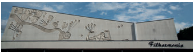
Барельеф «Полигимния» на фасаде здания филармонии на ул. Подлесной

Здание филармонии (поздний модернизм) было построено в 1975 году по проекту Кристины Древновской. В нём расположен концертный зал на 500 мест и камерный зал, а также комплекс музыкальных школ. В 1983 году на главном фасаде здания был установлен фигурно-орнаментальный барельеф «Полигимния» работы белостокского художника Ежи Григорчука.