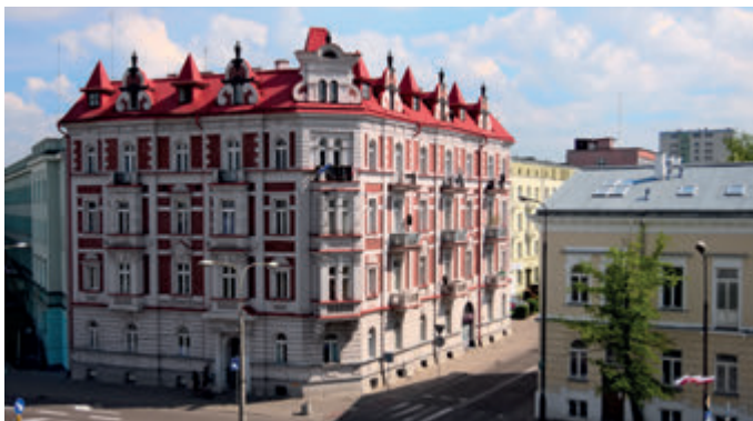
Каменный дом начала XX века на ул. св. Роха

Важным импульсом для развития города стало появление железных дорог. Первая из них, Варшава–Санкт-Петербург, пересекла Белосток в 1862 году. Тогда же был построен исторический вокзал, более 150 лет являющийся прекрасной визитной карточкой города.