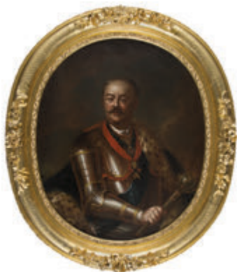
Ян Клеменс Браницкий, из коллекций Подляшского музея в Белостоке

Стремительный рост города начался во времена Яна Клеменса Браницкого – сына Стефана Миколая и Катажины Схластики из рода Сапег, который стал одним из самых влиятельных людей XVIII-вечной Речи Посполитой. Он был великим гетманом коронным. Был также краковским воеводой и, следовательно, первым сенатором Речи Посполитой. Во время последних выборов Браницкий претендовал на королевский трон. Во время его правления Белосток стал одним из важнейших центров, как на политической, так и на культурной карте Речи Посполитой того времени. При дворе гетмана бывали не только магнаты, видные художники и иностранные послы, но и коронованные особы во главе с зятем Браницкого, Станиславом Августом Понятовским.