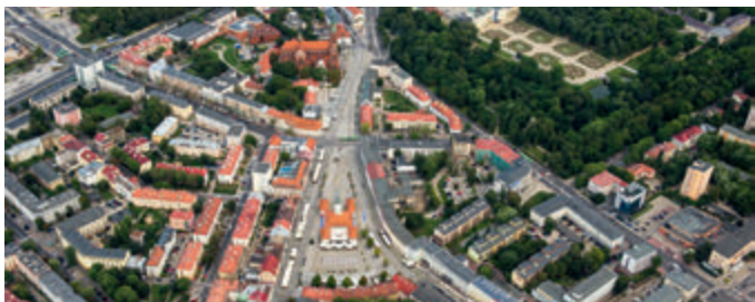
Белостокский треугольный рынок

В 1661 году тыкоцинские и белостокские владения были пожалованы Сеймом Стефану Чарнецкому в награду за заслуги в борьбе со шведами. В том же году король Ян Казимеж разрешил белостокскому плебану свободно торговать на костельных землях, что привело к созданию треугольного рынка. Такая форма рынка была обусловлена системой пересекающихся дорог в направлении Суража, Хороши и Василькова. Мы легко найдем её следы в нынешней форме Рыночной площади Костюшко. Это был первый шаг на пути к созданию города.