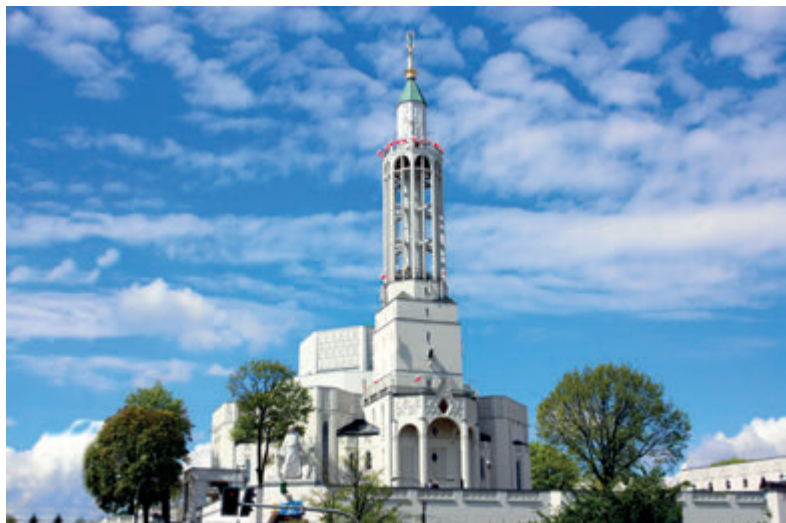
Базилика св. Роха

Сразу после войны в архитектуре доминировал соцреализм. Памятником того периода является огромное здание ЦК партии на площади Независимого объединения студентов, в настоящее время – одна из резиденций Университета в Белостоке. В 60-е и в 70-е годы появились очередные интересные проекты в стиле модерн. Приезжающие в Белосток поездом обязательно обратят внимание на позднемодерни-