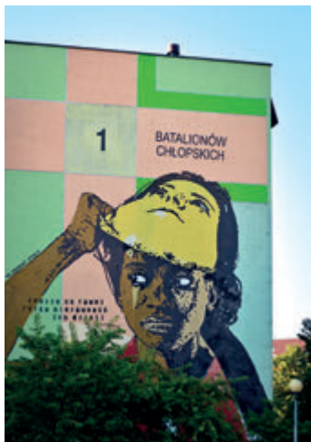
Неравенство

Художники группы Chekosart представили образ черной женщины, снимающей с лица маску белой. Антирацистское послание мурала просматривается еще сильнее, благодаря цитате из творчества Казимежа Пшервы-Тетмаера «Люди равны, только неравенство их разделяет». Мурал был создан в 2013 году по инициативе неформальной группы «Нормальный Белосток», которая пропагандирует толерантность и культивирует мультикультурализм Белостока.