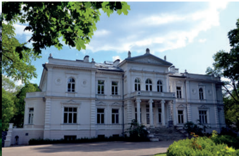
Дворец Крузенштернов

На небольшом расстоянии от дворца возвышаются постройки завода фанеры. В комплексе послевоенных промышленных зданий остались цех, дымоход и котельная, помнящие времена Хасбахов.