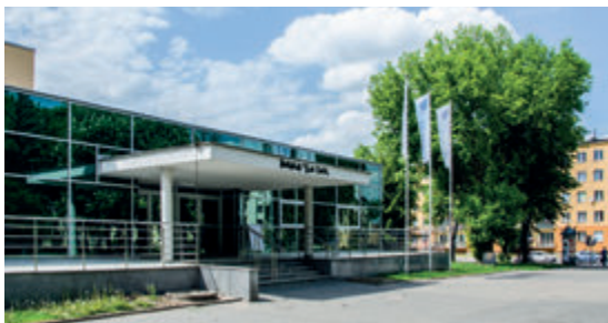
Белостокский театр кукол