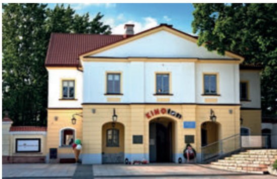
Бывший госпиталь

Прямо у ворот кафедрального комплекса находится старинная больница для белостокской бедноты, построенная на пожертвования гетмана Браницкого в 1762 году как приют «для семи костельных дедов и шести баб». Барокковая конструкция здания отличается большим ризалитом (часть здания, выступающая за основную линию фасада и идущая во всю высоту здания – пер.), увенчанным большим тимпаном. В результате более поздних перестроек, объект был оснащён