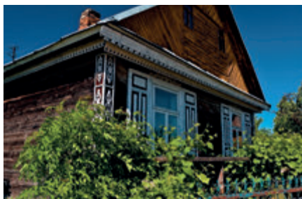
Дом в Стране открытых ставней

Среди зелени возвышаются цветные церкви, а традиционные дома восхищают искусными резными украшениями, вырезанными резных дел мастерами, и замысловатыми цветными ставнями.