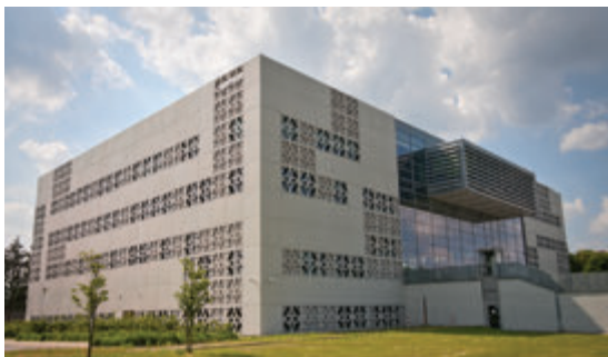
Центр современного обучения Белостокского политехнического университета