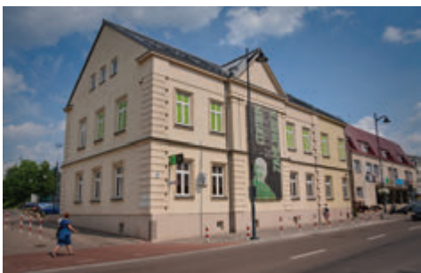
Центр им. Людвика Заменгофа – Белостокский центр культуры

В Центре работает мультимедийная постоянная выставка, благодаря которой можно перенестись во времена детства Людовика Заменгофа и поближе ознакомиться с городом и личностью создателя эсперанто. Здесь проходят также временные выставки, часто посвященные фотографии. Проводится много интересных культурных и образовательных мероприятий, учитывающих мультикультурализм Белостока.