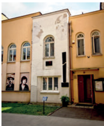
Синагога Цитронов

Немецкая оккупация закончилась не только гибелью еврейских жителей города, но и уничтожением большинства материальных ценностей, связанных с этой национальной группой людей. Центр Белостока практически перестал существовать. Из десятков синагог и молитвенных домов осталось всего три здания: синагога Цитронов, опустошенная молельня Пясковер на ул. Пенькна и полностью разрушенная (после войны восстановленная в очень упрощенной форме) синагога Самуила Могилевера на улице Браницкого. Раввинское кладбище было сровнено с землей.