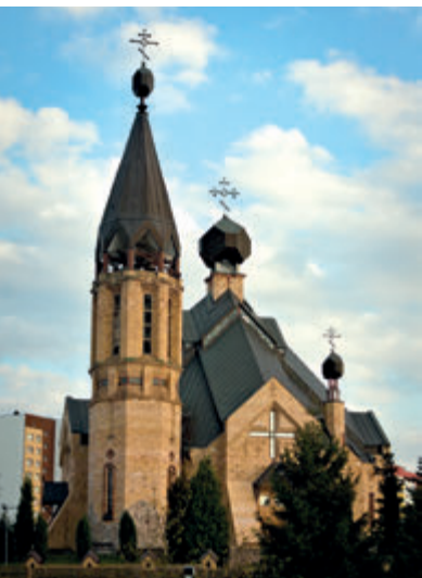
Церковь Воскресения Господня