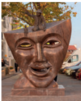
Маска на ул. Сураской

Уже более 40 лет Центр культуры организует «Осень с блюзом» - самый старый блюз-фестиваль в Польше, и 35 лет - «Блюзовые задушки». Благодаря им Белосток стал важным пунктом на карте блюза Польши. Материальным следом этих связей является Аллея блюза, расположенная между улицами Сураской и Легионовой. Каменные плиты уложены в форме клавиш фортепиано, а металлические таблички знакомят нас с представителями и популяризаторами этого жанра музыки.