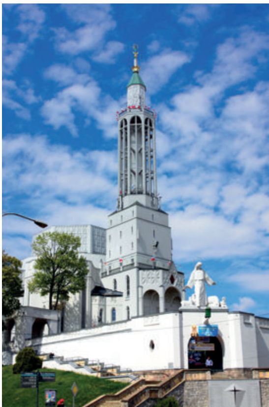
Базилика св. Роха

этого намерения удалось осуществить только Белостокский храм – утреннюю звезду, являющуюся, одновременно, расветом независимости. Глядя на костёл св. Роха, стоит помнить, что его проект наполнен глубоким символическим содержанием. Архитектурно-художественным отражением идеи утренней звезды является как пространственная планировка храма, так и повторяющийся звездно-хрустальный мотив декора.