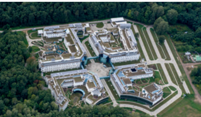
Кампус университета с высоты птичьего полета, фото Администрация города Белостока