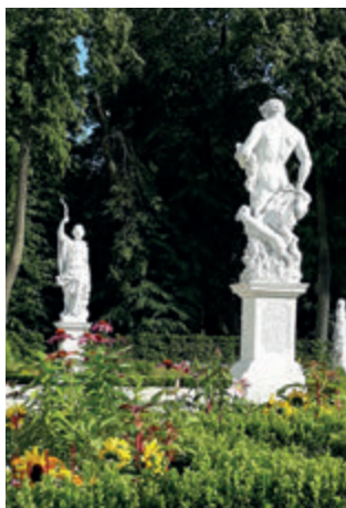
Скульптуры в Садах Браницких

В Белостоке Браницкий создавал садовую часть по образцу мифологического сада Гесперид, с фонтанирующими источниками, в котором росли золотые яблоки бессмертия, и прогуливались боги, встречаясь время от времени со смертными. Отражением этой идеи были многочисленные фонтаны и большие статуи по обе стороны главной аллеи, представляющие мифологических богов, часто расположенных, напротив, связанных с ними смертных, например, Диана и Актеон. С более чем 200 барочных статуй и скульптур до наших дней сохранилось всего 13 (установленных в парке до 1755 года, о чем свидетельствуют помещённые на них таблички). Недостающие скульптуры на главной аллее были восстановлены в 50-е годы XX века. Статуи были подписаны, что помогает понять идейную программу композиции и связь между персонажами.