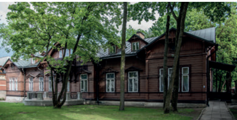
Вилла генерала фон Дрисена

жем получить через несколько десятков метров дальше. Типичный для довоенного пейзажа Белостока «деревянный дом» на улице Мазовецкой 52 сохранился до наших дней.