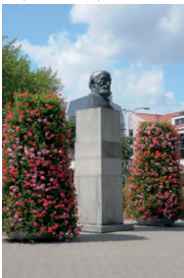
Памятник Людвигу Заменгофу

Несомненно, самым известным в мире человеком, связанным с Белостоком, является Людвик Заменгоф. Создатель международного языка эсперанто провел в столице Подляшья несколько первых лет своей жизни. Как он сам отмечал, это был важный период для формирования его восприятия мира: Это место моего рождения и