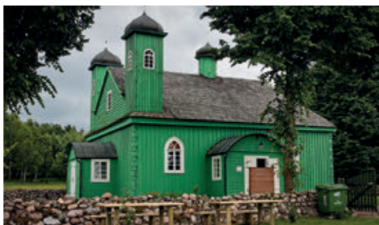
Мечеть в Крушинянах

ляшья. Благодаря уникальному микроклимату он имеет статус курорта. Туристов привлекают не только его природные особенности и своеобразное очарование размеренного ритма жизни, но и уникальные памятники. Сердцем города уже 500 лет является православный монастырь с впечатляющей готической церковью-крепостью Благовещения Пресвятой Богородицы. Множество туристов привлекает известный музей икон, а также Музей печатного искусства и бумажного производства. В центре городка находится эклектичный дворец Буххольцев, а вдоль соседних улиц сохранились XIX-вечные дома ткачей, являющиеся напоминанием времен, когда в Супрасъле динамично развивалось текстильное производство.