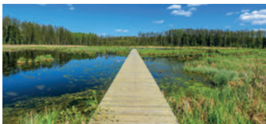
В Кнышинской пуще

Начинается практически на окраине Белостока и является крупнейшим региональным ландшафтным парком в нашей стране. Предлагает бесчисленные маршруты для любителей пеших походов, велосипедных, конных и лыжных прогулок. Охраняет уникальную флору и фауну Подляшья – на территории этого ландшафтного парка находится двадцать один резерват. Гуляя по Кнышинской пуще, вы можете легко наткнуться на тропы зубров, волков и даже рысей.