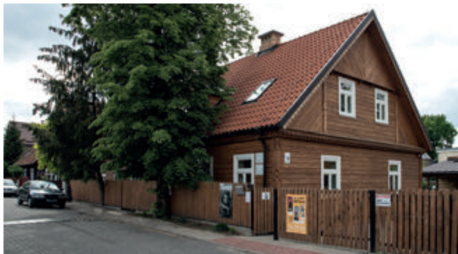
Дом на [ул. Виктории, 5] в Боярах, в котором размещена фотогалерея

ритмом. Узкие, извилистые мощные улочки и оплетённые диким виноградом дома являются реликвией Белостока 20-ых и 30-ых годов XX века. Однако история района намного длиннее. В XV веке здесь было основано первое сельское поселение, населённое боярами – придворной челядью. По сей день в градостроительной системе можно увидеть прежнюю систему расположения полей. Здесь проходили главные дороги – Большая литовская дорога и Базилианский путь, а тракт, разделяющий белостокские и дойлидские земли (т. е. сегодняшние улицы Скорупская и Далёкая) был одно время даже государственной границей. С 1569 года тракт разделял земли Короны и Великого княжества литовского. Большие изменения ввел здесь гетман Браницкий, разместив Новый город, в котором поселил придворных чиновников, ремесленников и художников. На рубеже XIX и XX веков в Боярах свои дома начала возводить бе-