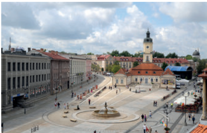
Рыночная площадь Костюшко с ратушей

Яна Клеменса Браницкого. На фоне послевоенной застройки они выделяются барокковыми архитектурными формами и яркими фасадами в бледно-желтых и белых тонах.