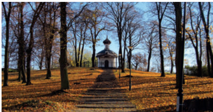
Церковь св. Марии Магдалины

Современная церковь расположена на холме, ласково именуемом белосточанами Магдаленкой, она была построена на пожертвования Яна Клеменса Браницкого примерно в середине XVIII века как римско-католическая часовня, принадлежащая к так называемой алтарии св. Роха. В это же время вокруг здания было создано кладбище. В результате изменений, происходящих в населяющих Подляшье религиозных общинах, часовня меняла владельцев – была местом молитв и греко-католиков (униатов) и православных. Кладбище тоже со временем стало многонациональным. В настоящее время церковь принадлежит православному Ординариату польской армии, а часть холма (бывшего кладбища) занимает современное здание оперы.