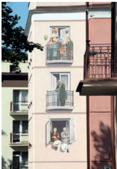
Мурал на месте, где находился родительский дом Людвика Заменгофа

До 30-х годов XX века на этом месте стоял деревянный дом, в котором 15 декабря 1859 года родился Лейзер (Людвик) Заменгоф. Семья проживала на втором этаже здания вплоть до выезда из Белостока в 1873 году. В настоящее время это место украшает мемориальная доска и мурал, на котором