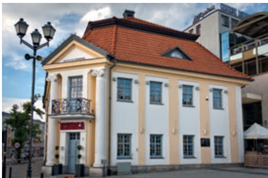
Астория