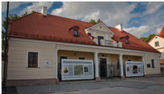
Бывший цекхауз

Здание было связано с впечатляющей, хотя и неподтвержденной никакими успехами, военной карьерой гетмана Яна Клеменса Браницкого. Здесь находились помещения для военного караула, хранилось оружие и пожарное оснащение.