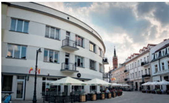
Модернистское каменное здание на ул. Килинского, фото А. Тарасевич