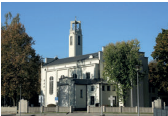
Костёл Непорочного Сердца Марии в Дойлидах

роко. Таким образом объект вписывается в присутствующее в архитектуре направление восстановления выдающихся, но уже несуществующих, исторических зданий.